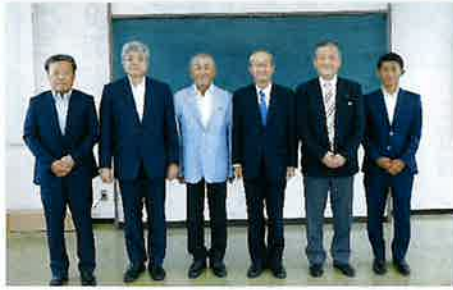
当時の青年部会の方と記念撮影 可部国税庁長官：右から3人目

可部国税庁長官は、平成3年に岸和田税務署長に赴任されており、当日は、岩出協会長と面談され、その後、当時の青年部会の会員との懇談会にご出席いただきました。