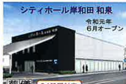
シティホール岸和田 和泉