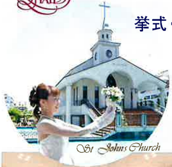
St. John's Church