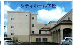
シティホール下松