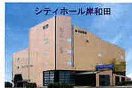
シティホール岸和田