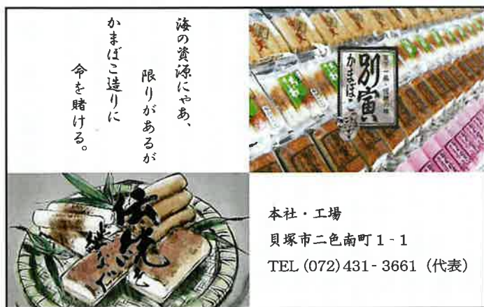
本社・工場 貝塚市二色南町1-1 TEL (072) 431-3661 (代表)