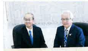
右：岩出納税協会長 左：可部国税庁長官