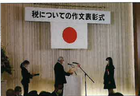
税についての作文表彰式