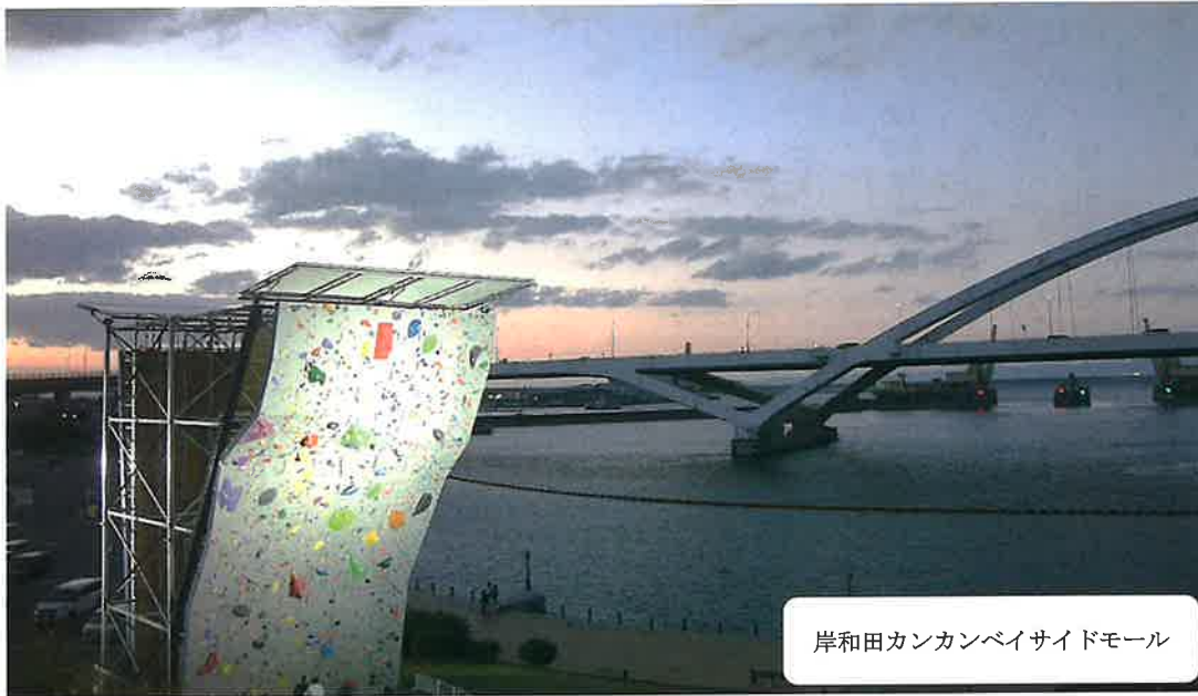
岸和田カンカンベイサイドモール