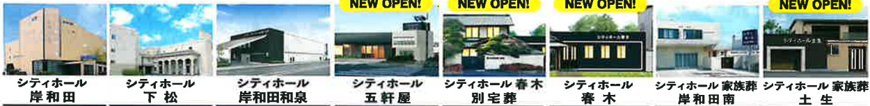
シティホール 岸和田