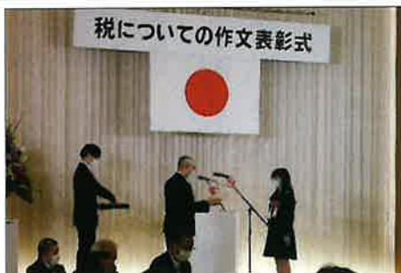
税についての作文表彰式