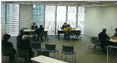
貝塚市役所 4階多目的室