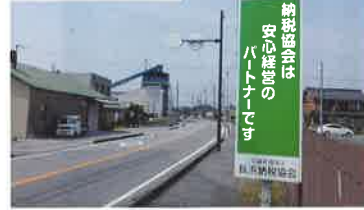
近江化学工業(株) 本社前

平成26年11月に、JR米原駅西口及び近江化学工業(株)本社前の「税の広報塔」をリニューアルしました。