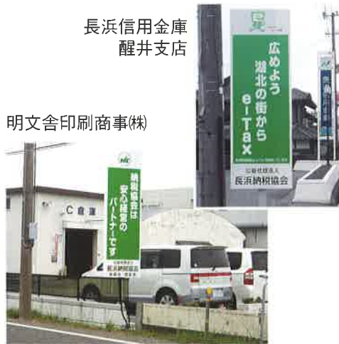
長浜信用金庫 醒井支店