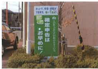
日本ピーエムエス(株)

これらの「立看板」は、公益社団法人長浜納税協会が事業活動の一環として作成したもので、「確定申告書の早期提出」と「e-Taxの利用推進」を目的としております。