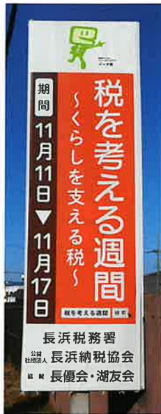
場所：近江化学工業(株) 本社前（湖岸道路）

税を考える週間に「集客をしない広報活動」の一環で前年度から広報塔にシートカバー（本年度追加五基）を設置し、本年度で計十基になりました。