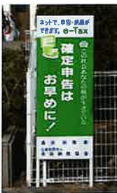
マツイ機器工業(株)