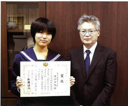
大阪国税局長賞受賞者

長浜市と米原市の十四の中学校から七百十六編の応募が寄せられ、厳正な審査の結果、次のみなさんが受賞されました。受賞されたみなさん、おめでとうございます。(順不同・敬称略)