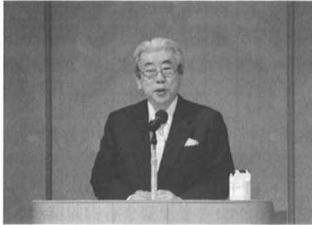
社会長 総会開会あいさつ

公益社団法人阿倍野納税協会は第4回定時総会を5月28日「ホテルアウイーナ大阪」で開催しました。 上程しました議案は次のとおりです。 第1号議案 議事録署名人選出の件 第2号議案 平成25年度事業報告及び附属明細書の件 第3号議案 平成25年度計算書類（貸借対照表及び正味財産増減計算書）及び附属明細書並びに財産目録承認の件 第4号議案 理事60名選任の件 第5号議案 監事3名選任の件 議事の経過と結果 第2号から第5号議案は、