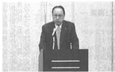
定時総会冒頭 高松会長あいさつ