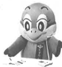
「大阪府広報担当副知事 もずやん」

【お問い合わせ】 なにわ南府税事務所 個人事業税課 TEL 06-6775-1414 (代)