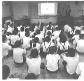
「税金」の仕組み、働きを学ぶ租税教室