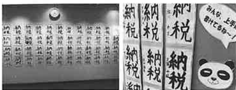
近鉄百貨店 その2 キューズモール その2