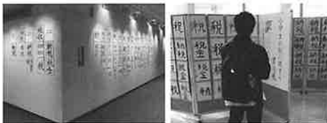
近鉄百貨店 その1 キューズモール その1

阿倍野納税貯蓄組合連合会及び阿倍野税務署は共催により、第2回税に関する小学生の「書道展」を開催し、区内の6小学校から応募があった144編全作品をそれぞれ2会場に順次、展示いたしました。