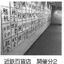
近鉄百貨店 開催分2

★ 令和5年10月1日から「適格請求書等保存方式(インボイス制度)」が導入されます。適格請求書発行事業者(登録事業者)のみが適格請求書(インボイス)を交付することができます。この登録申請の受付が令和3年10月1日から始まっています。