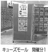
キーズモール 開催分1

阿倍野納税貯蓄組合連合会及び阿倍野税務署は共催により、第3回税に関する小学生の「書道展」を開催し、区内の6小学校から応募があった365点全作品を2会場に順次、展示いたしました。