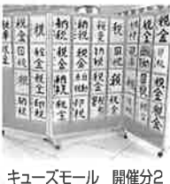
キーズモール 開催分2