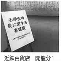
近鉄百貨店 開催分1