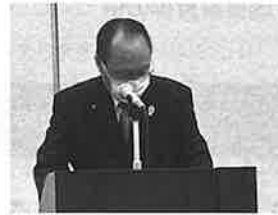
定時総会 冒頭あいさつ