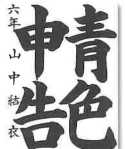
魚崎小 山中 結衣