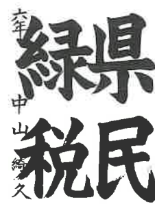
本山第三小 中山 綺久