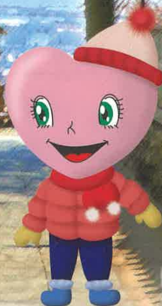
芦屋納税協会 キャラクター ハーディーちゃん

納税協会は健全な納税者の団体として、税知識の普及に努め適正な申告納税の推進と納税道義の高揚を図り、企業および地域社会の発展に貢献します