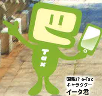
国税庁 e-Tax キャラクター イータ君