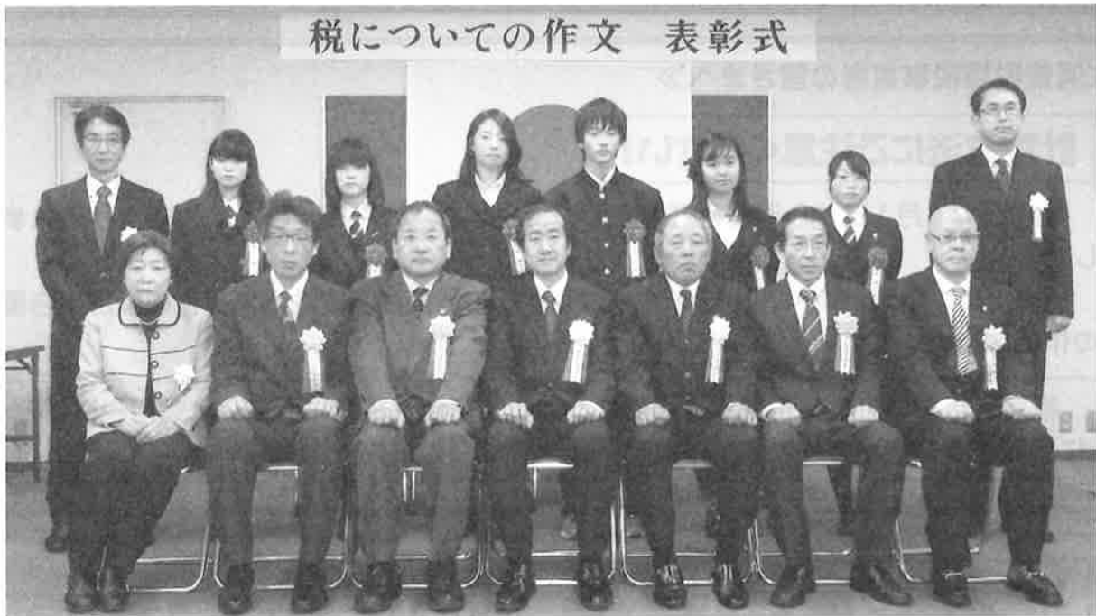
中学生・高校生の「税に関する作文」について、平成26年12月16日、伏見税務署において、優秀な作文を提出した生徒の皆さんの表彰式が行われました。