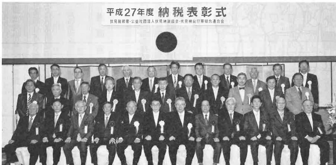
平成27年度 納税表彰式