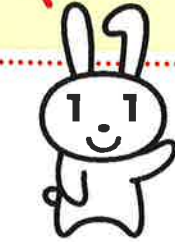
マイナンバーPRキャラクター マイナちゃん