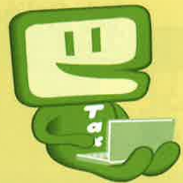
国税庁 e-Tax キャラクター イータ君