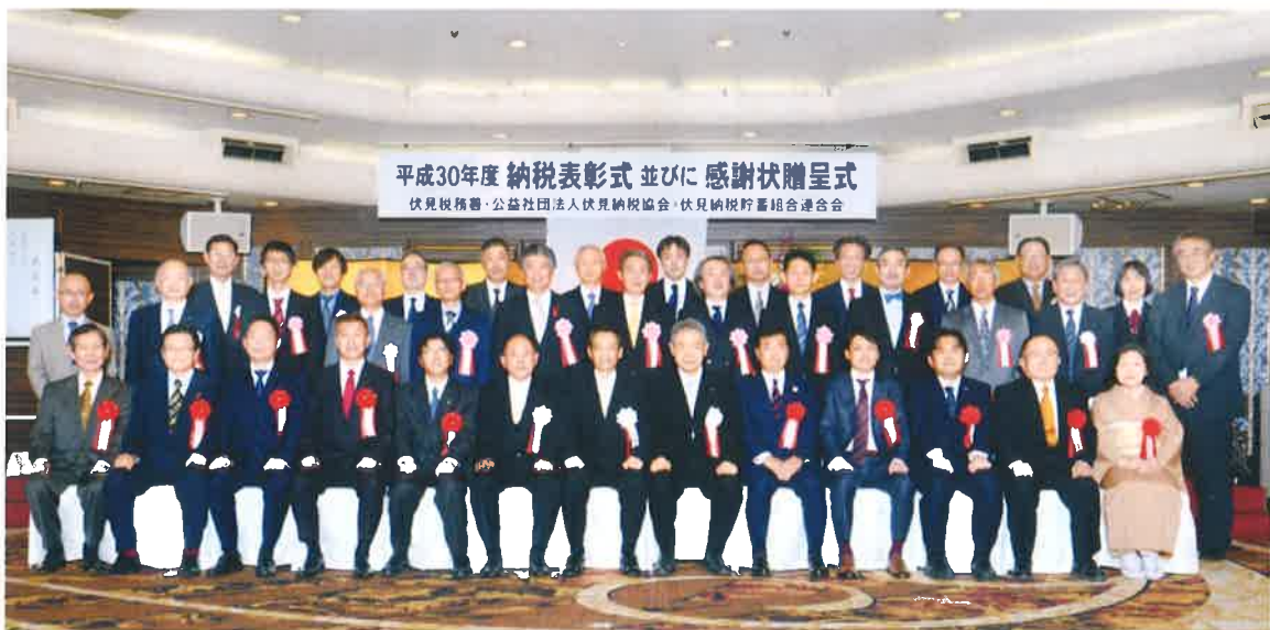
平成30年度 納税表彰式