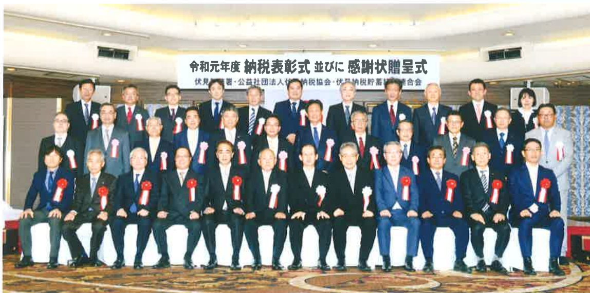
令和元年度 納税表彰式