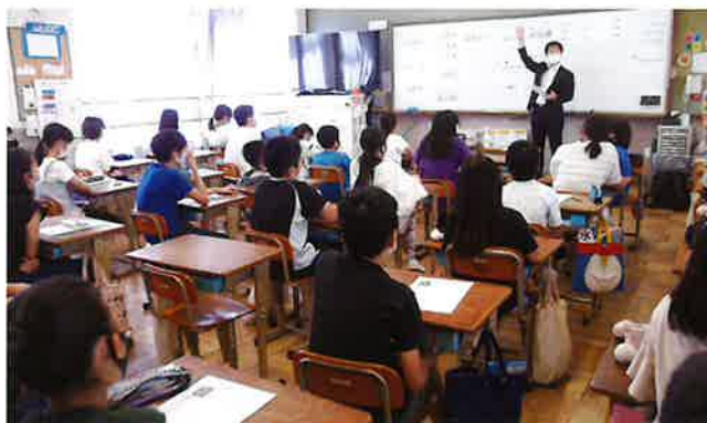
京都市立砂川小学校で租税教室

今後は、2月2日に桃山東小学校、2月17日に稲荷小学校で開催予定となっています。