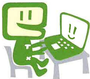
国税庁e-Taxキャラクター:イータ君