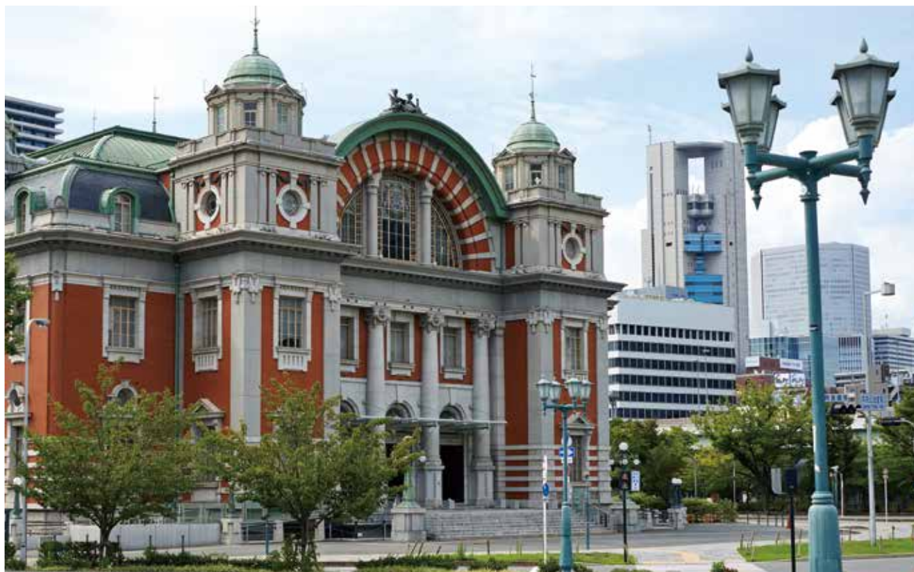
大阪市中央公会堂