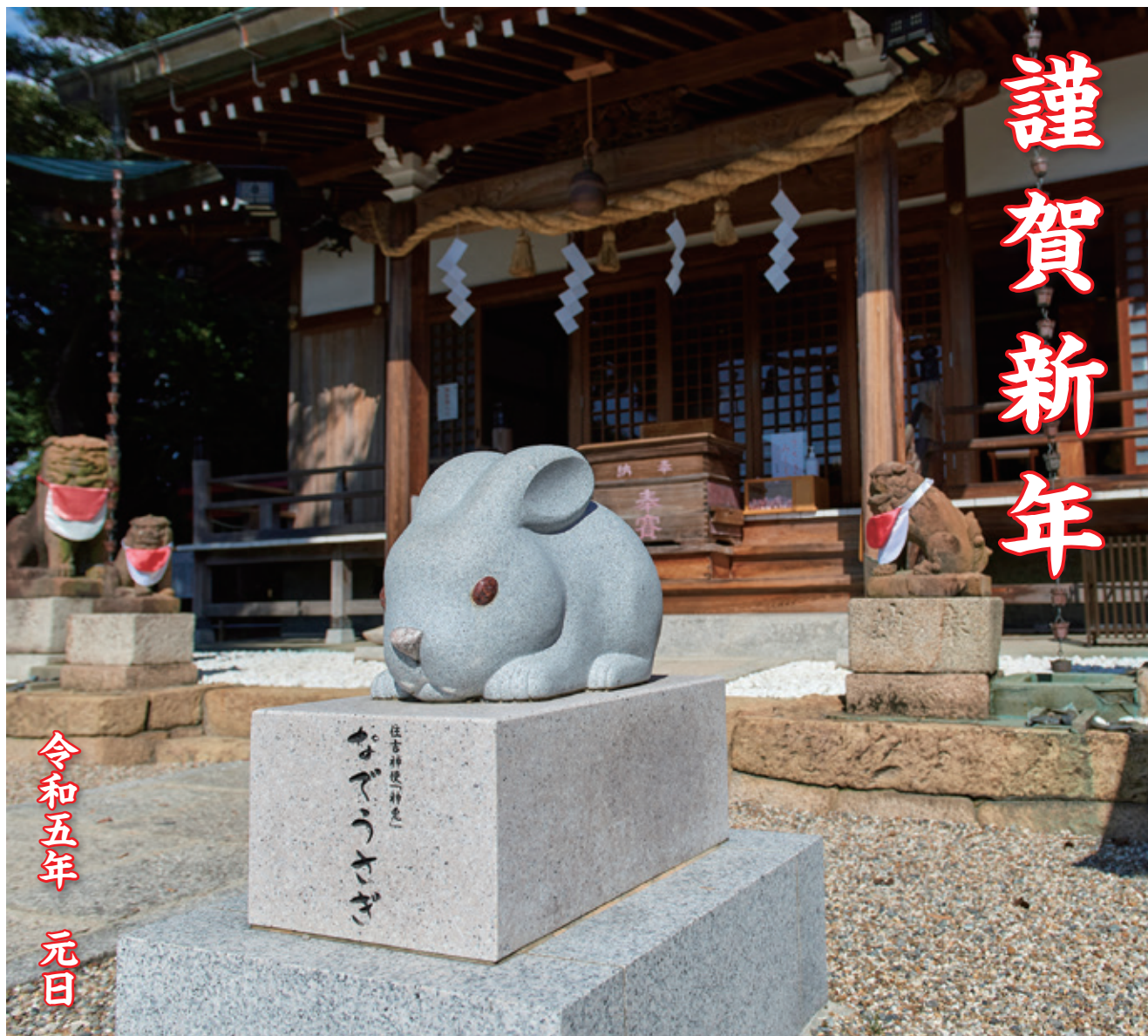
若宮 住吉神社「なでうさぎ」