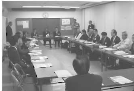
交野第一・第二地区