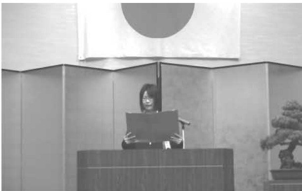
11月13日 納税表彰式 中学生の「税についての作文」朗読