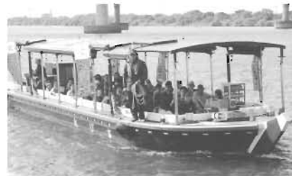
観光協会「淀川舟運イベント」

運営協議会は、2006年度から『枚方フェスティバル協議会』に改称され、各地域や団体が「まつり」を相互応援し、バックアップ機能を発揮