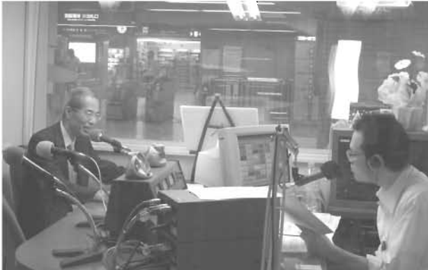
11月10日 FM ひらかた 署長生出演