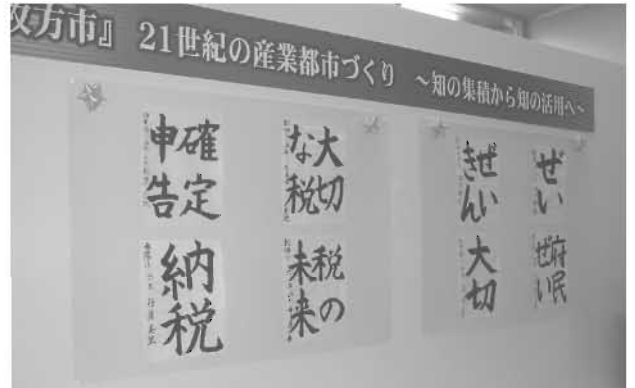
11月11日 小学校の税に関する習字展 枚方市役所別館1階ロビー