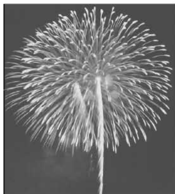
「くらわんか花火大会」の一発！

枚方市では、ボランティアで開催されている「市民のまつり」が、ここ数年大きく様変わりしてまいりました。「枚方まつり」は、発足当時は、市民祭として8年間開催し、その後、第9回からは市民祭に加えて、関西テレビ主催の花火大会を3年間、その後、市民ボランティアが引き継いで、20年の長きにわたり、市民祭とくらわんか花火大会が開催されてきました。それが、平成15年に開催されました「第28回枚方まつり」でエンディングを迎えました。最後の『くらわんか花火大会』には、周辺各市からの展望により、主催者発表で、参加者は30万～50万人とも言われている近隣屈指の大イベントに成長していました。それだけに、惜しまれる声も大きかったものの、安全対策費も含めて、警備、会場設営等に膨大な予算を必要とし、近時の景気の後退、低迷とともに、資金の集まりに陰りを見て、関係者は大きな行き詰まりを感じるようになってしまったのです。