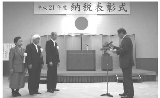
11月13日 納税表彰式 受表彰者代表挨拶