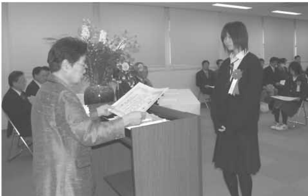
11月20日 中学生の税の作文表彰式