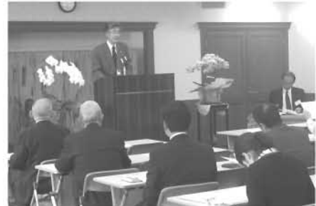
寝屋川第一・第二・第三地区