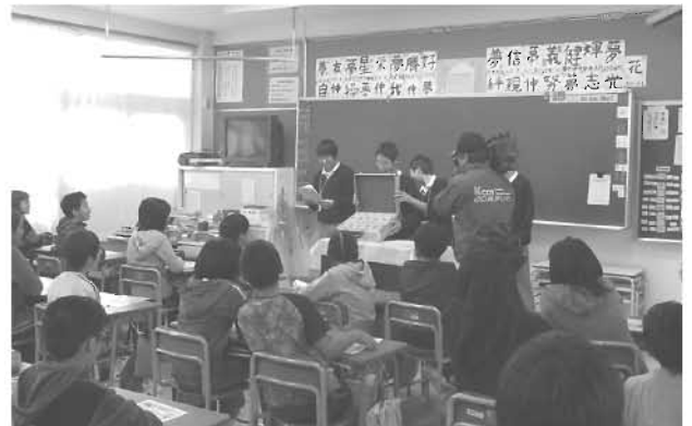
11月13日 中学生の小学校での租税教室講師体験学習