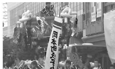
秋祭り「ふとん太鼓巡行」

市内では下記のように歴史のある神社秋祭りも、随所に見られますが、今後、この紙面にてご紹介させて頂ける祭りもあるでしょう。