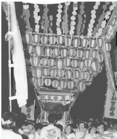
市民祭の懐かしい「ちょうちんみこし」

この枚方まつりがこれまで演じてきた役割は、地域の活性化と子供たちの思い出づくり、夏の風物詩そして故郷意識の高揚など、決して小さいものではありません。