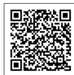
神戸市HP 現所有者の申告制度