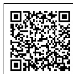
神戸市HP 償却資産の申告