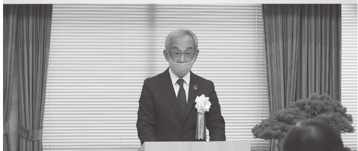
〔主催者代表あいさつ〕大森兵庫納税協会会長