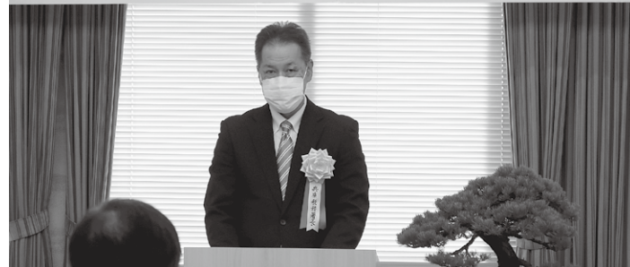
〔来賓祝辞〕葛西兵庫税務署長