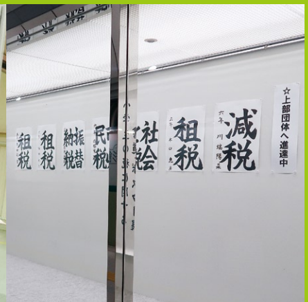
谷上ドームギャラリー