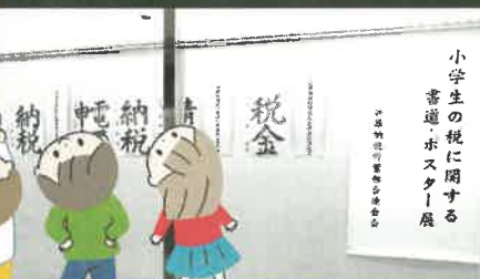
谷上ドームギャラリー