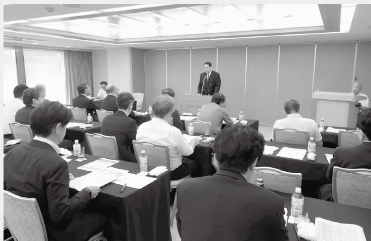
風早組織拡大委員長