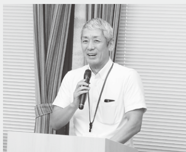
茂利兵庫税務署長