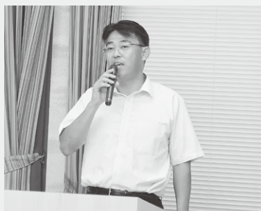
安田税研会部会長