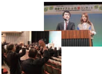
税金クイズに多数参加