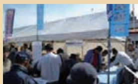
○守口市民まつり(11・4)