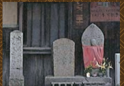
清滝街道、東高野街道の道しるべ

そして、四條畷の歴史を物語る古代から中世、近世、近代の史跡、文化財が多く、昔を偲ぶ5つの街道があります。主な街道として古(いにしえ)から多くの旅人がこの街道を行き交ったことも畷が街道の交差点と言われる所以です。清滝街道、東高野街道、河内街道、古堤街道、磐船街道をご紹介します。昔を偲んで街道を散策するのも楽しみです。