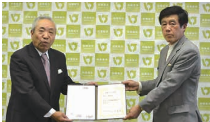
四條畷市観光大使に就任(H24.4)

私の会社も企業の成長戦略の一つとして無人機製作に取り組み、開発費も約一億円を投資、開発中です。(株)アオキの方は東大阪の会社と宮崎に事業所を立ち上げてから本格的に、新産業に取り組んでいます。会社の方は後継者がしっかり守ってくれており、私の夢への挑戦はこれからも続けていきます。