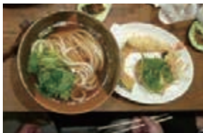
お薦めの一品 天ぷら付釜揚げうどん

にしたのもお年寄りや子供さんにも食べやすく美味しく食べてもらいたいという手打ちうどんは新鮮そのもので湯がきたても嬉しい本気うどんが真骨頂!当店の人気メニューは、天ぷら釜あげうどん、天ぷらおろししぶつかけうどん、竹玉天付釜バターうどんに明太子うどんが人気。