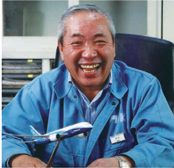
株式会社アオキ 代表取締役 四條畷市観光大使・東大阪市モノづくり親善大使