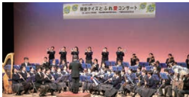
大阪桐蔭高等学校吹奏楽部のみなさんの演奏