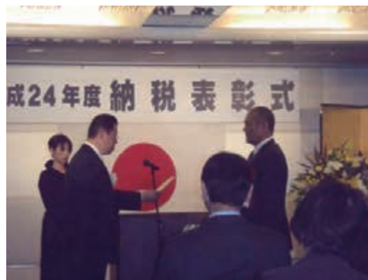
厳粛に行われた納税表彰式