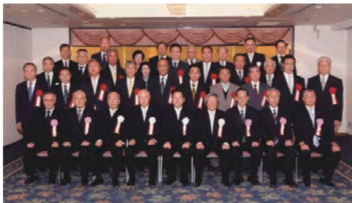
晴れの受彰者の方々