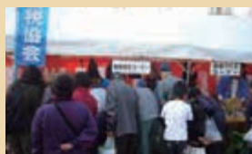
○門真市農業まつり(11・10)