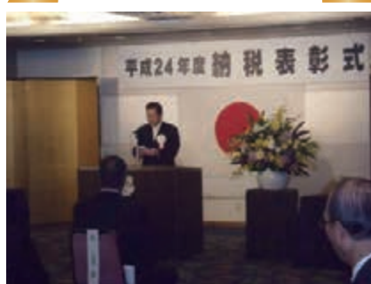
H24.11.16 於：ホテル・アゴラ大阪守口