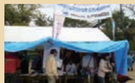
○四條畷市民の集い(10・28)