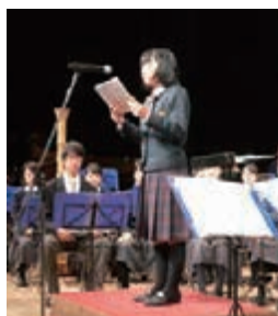
税の作文朗読を行う四條畷南中学校と大阪桐蔭中学校の生徒さん