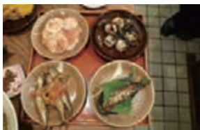
おばんざいも人気

富蔵の人気の秘密は何といっても多彩な活麺(うどん)のトッピングの品数。新鮮な魚類(エビ、イカ等)と豊富な旬の野菜。そして味付け抜群の出汁が特徴。その秘密は利尻昆布、香川観音寺