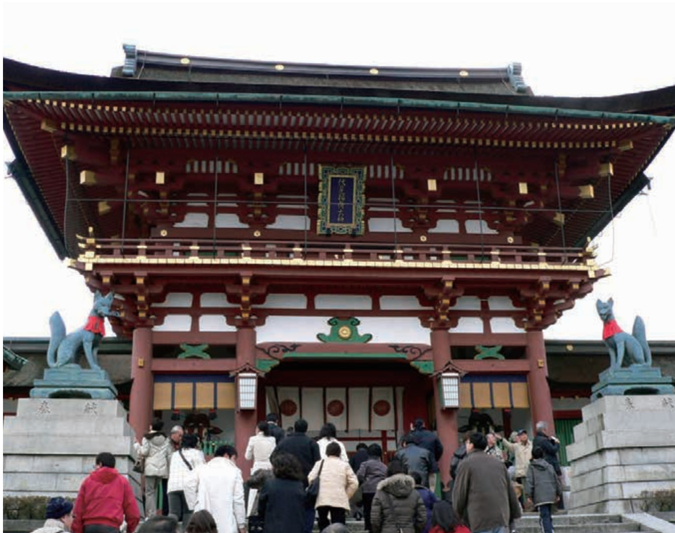
伏見稲荷大社