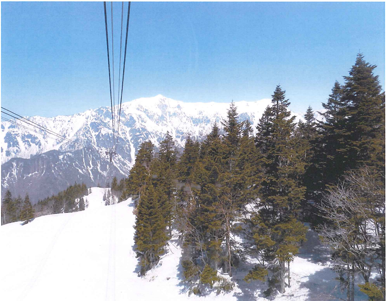
新穂高ロープウェイより