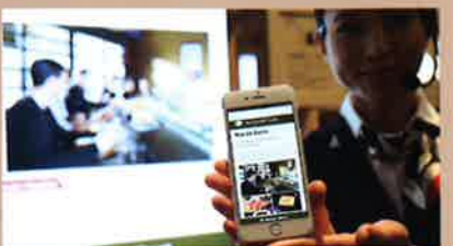
パナソニックの「光ID」技術は照明の光にスマートフォンをかざすだけで、様々な情報を取得できる。

東京オリンピック・パラリンピックが開催される2020年に向けて開発中の各種技術を公開した。「おもてなし」をキーワードに、ペンダント型の自動翻訳機をはじめとした多言語対応技術や、個人認証やセキュリティ対策に利用する技術などを披露した。