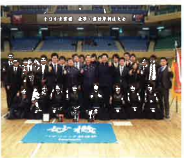
パナソニック剣道部女子が全日本実業団剣道大会で優勝した時のものです。男子は3年前に優勝、女子は現在2連覇中です。

翻訳エンジンには、情報通信研究機構(NICT)が開発する技術を採用。これをベースに、マイクの雑音除去技術などパナソニック独自の技術を盛り込んで開発を進めている。