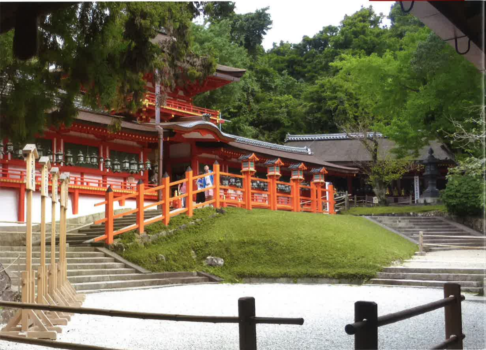
表紙写真：世界遺産の春日大社御本殿から御蓋山を望む