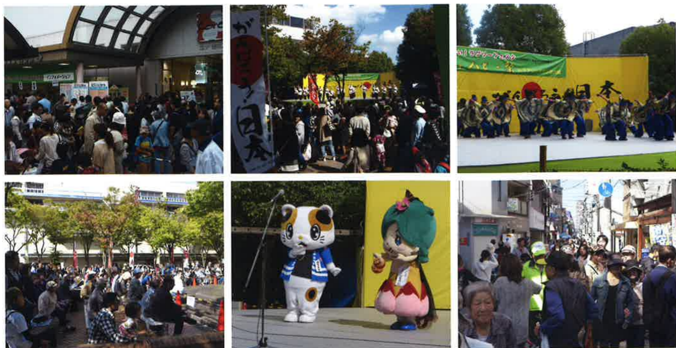
上左/インフォメーションでの美化推進運動など 上中、右/サンジョゼひろばの大阪メチャハッピー祭 下左/門真市はじめ多くの方がフェスタに 下中/ガラスケや蓮ちゃんもPRに 下右/得々にぎわい商店街に多くの人達が