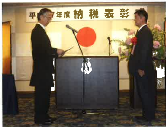
厳粛に行われた納税表彰式