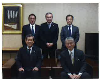
インタビューを終えて、長榮会長と共に取材の協会役員と共に。

東京オリンピック・パラリンピックが開催される2020年に向けて開発中の各種技術を公開した。「おもてなし」をキーワードに、ペンダント型の自動翻訳機をはじめとした多言語対応技術や、個人認証やセキュリティ対策に利用する技術などを披露した。