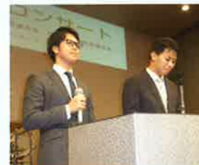
税金クイズに挑戦