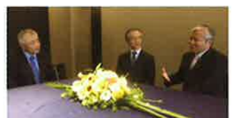
藤本広報部長より両氏にこれからの指針について伺う。

和歌山県の粉河税務署（管内には高野山や粉河寺などあり）でも署長を、副署長は茨城県の土浦税務署（霞ヶ浦や筑波山などあり）で勤めました。それぞれの赴任地では、その地の歴史や名所旧跡に興味を持ち、各地を散策しました。当地においても、管内のいろんなところを見て歩き、新しい発見や地域の方々との触れ合いを大切にさせていただき、守口、門真、大東、四條畷のことが大好きになりたいと思っております。