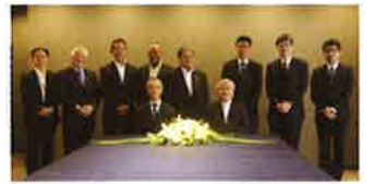
署長・会長対談を終え、両代表エールを交換！