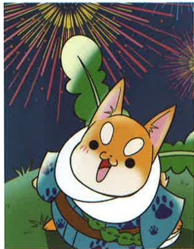
市制70周年記念事業の花火大会ポスターに登場