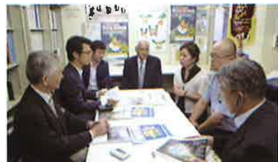
担当の守口市広報広聴課、地域振興課にインタビューする広報役員