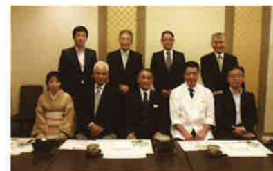
上田総支配人、太田料理長と共に広報部会守口地区役員が