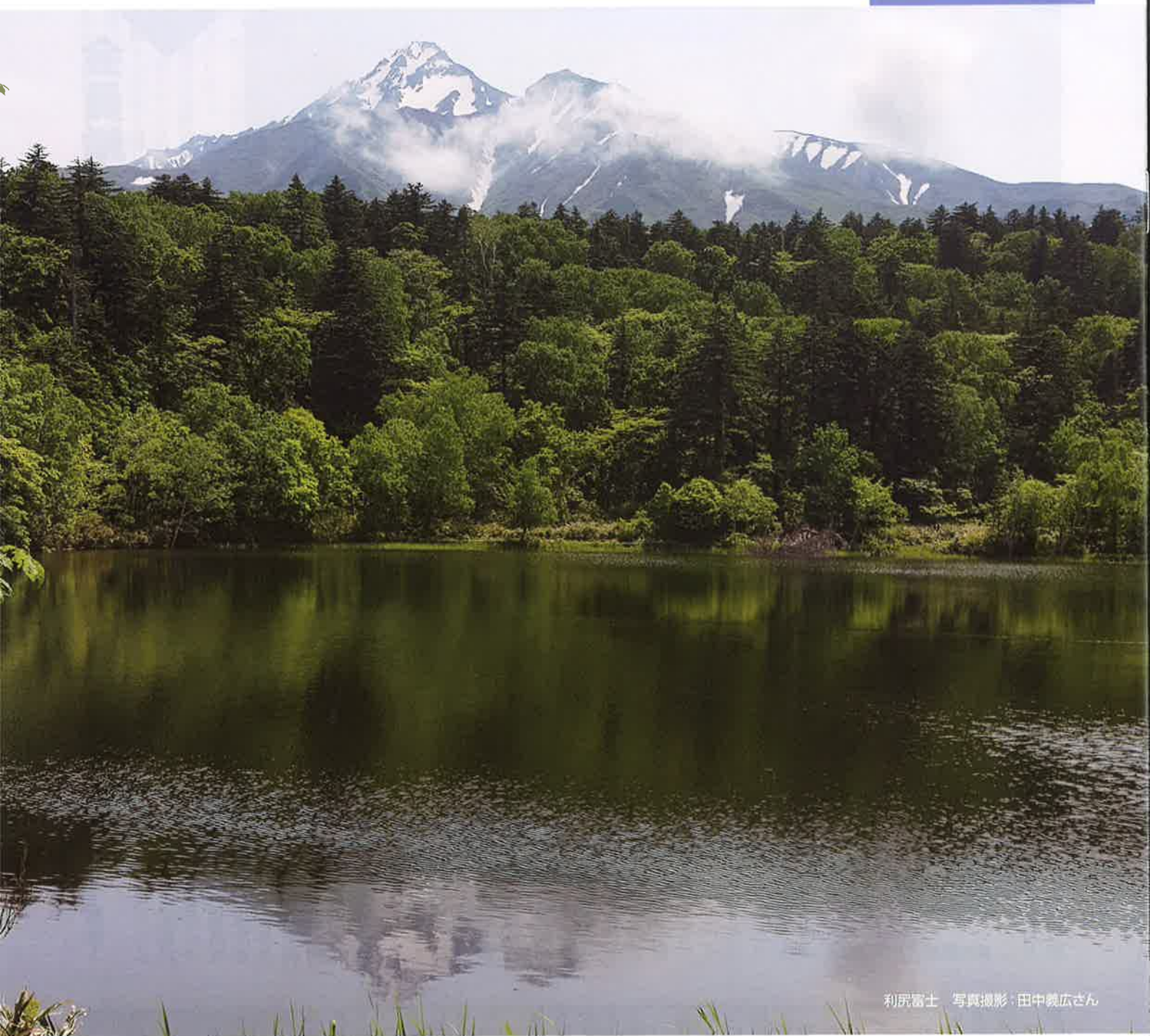
利尻富士