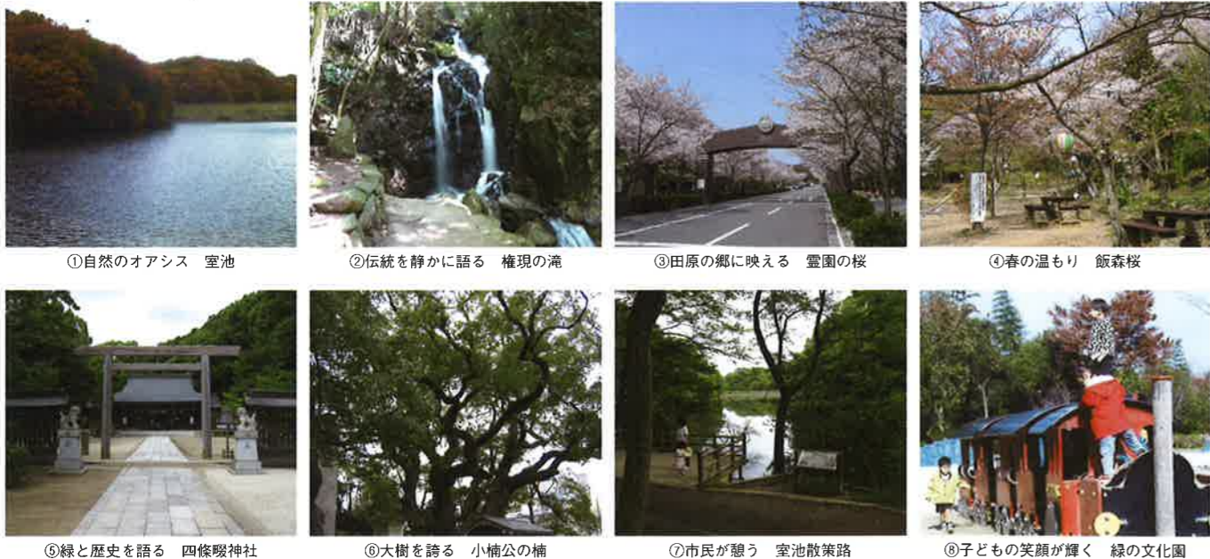
①自然のオアシス 室池 ②伝統を静かに語る 権現の滝 ③田原の郷に映える 霊園の桜 ④春の温もり 飯盛桜 ⑤緑と歴史を語る 四條畷神社 ⑥大樹を誇る 小楠公の楠 ⑦市民が憩う 室池散策路 ⑧子どもの笑顔が輝く 緑の文化園