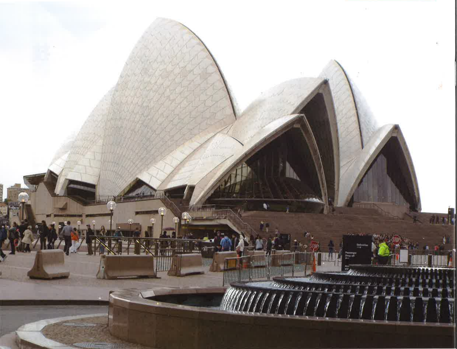
オーストラリアを代表する世界遺産、オペラハウス