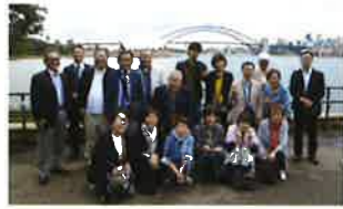
ミセスマッコリーズチェアからオペラハウスをバックに参加者一堂