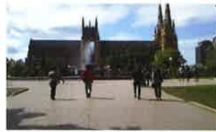
オーストラリアで最初のカトリック教会「セントメアリー大聖堂」