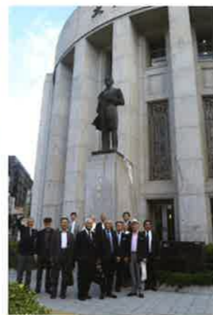
五代友厚ゆかりの地、大阪株式取引所跡の五代の銅像前にて