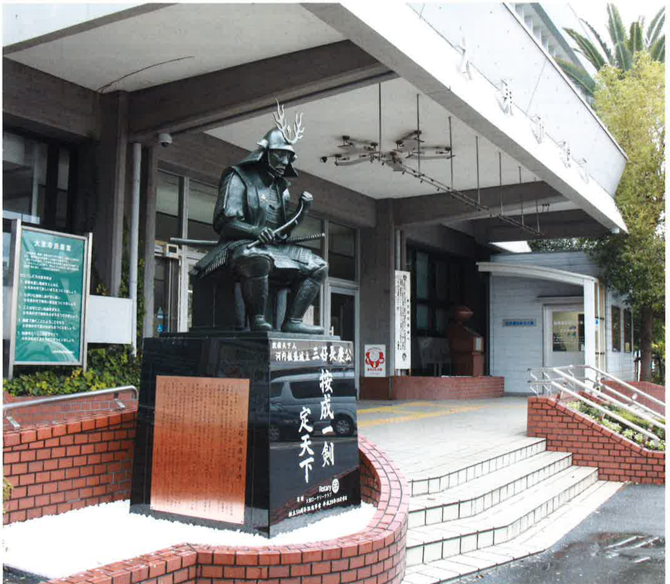
大東市役所正面玄関に設置された三好長慶像