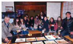
難宗寺、明治天皇御在所にて