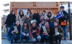
守口宿フィールドワークの文祿塚の高札場にて

国際教養学部の国際観光学科の学生と共に、歴史文化を活かした守口の魅力を探る。自ら学生達と守口探検隊を発足させて、昨年12月守口・京街道をフィールドワーク。