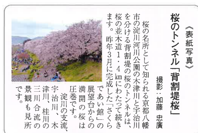
《表紙写真》 桜のトンネル「背割堤桜」