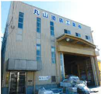
〔丸山塗装工業株式会社〕

住所 〒571-0045 門真市殿島町14-13 創業 昭和46年4月 設立 昭和56年4月 TEL 06-6909-8161 FAX 06-6909-3876