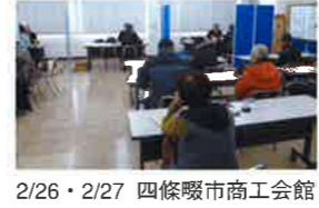
2/26・2/27 四條畷市商工会館