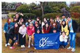
学生と共にフィールドワークへ

前身は昭和4年の高等女学校に遡り、昭和63年、国際化時代の到来に対応する人材の育成を教育理念に開設。2018年4月には経営経済学部を設置、またスポーツ行動学科を共学化。変動の激しい現代社会において、国内外の様々な分野で活躍できる人材の養成を目的に、全人教育と国際教育を推進している。