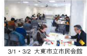
3/1・3/2 大東市立市民会館