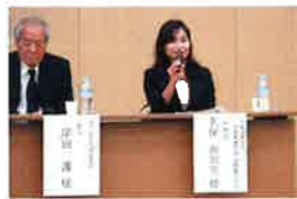
2016年12月守口市制70周年シンポジウムゲストパネラー出演