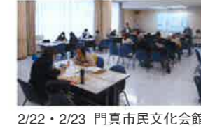
2/22・2/23 門真市民文化会館