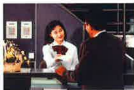
JALの海外(イギリス)勤務で活躍