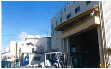
門真市殿島町の本社工場社屋