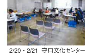
2/20・2/21 守口文化センター