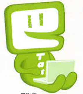
国税庁 e-Taxキャラクター イータ君