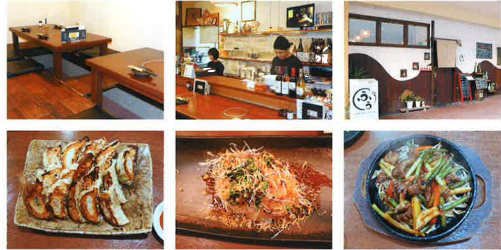
(上左) 宴会等には掘りごたつ席も (上中) カウンター内で調理中の神守さんご夫妻 (上右) お店の外観 (下左) 自家製焼きギョーザ (下中) 鯛の刺身中華風 (下右) 豚カルビとニンニクの芽のピリ辛炒め