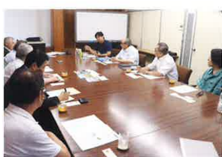
今回の商品開発に携わった製作事業者が一堂に会して。商品開発の経緯やセラミックスの専門的な技術、商品に掛ける熱い想いについて話していただいた。

ケース製造を担当した共栄化成(株)はプラスチック成形の専門企業です。今回は、設計図すらない状況でカプセルの開発協力となりました。 この度開発した商品「Poton(ポトン)」は、セラミックスの抗菌作用を活かした商品を地元大東のものづくり企業で作ろうという構想のもと、大東商工会議所の紹介で出会った異業種の会社が共同で作成したものです。