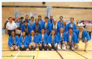
門真地区青年部会の皆さん