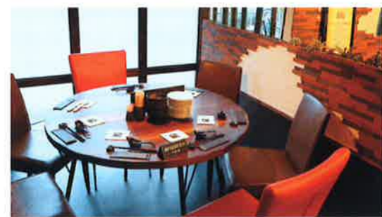
(左上)フカヒレの姿煮込上海風 (中上)大海老チリソース煮 (中)北京ダッククレープ包み (中下)三元豚の特製酢豚 (右上)元龍菜玄關 (右下)店内テーブル席