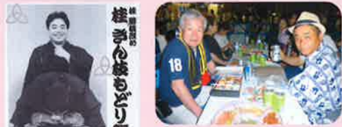
(中左)高津宮にて襲名発表会見 (中右)がっぷり寄席 (下左)もどり襲名の会 (下右)当協会の会員交流事業に参加。