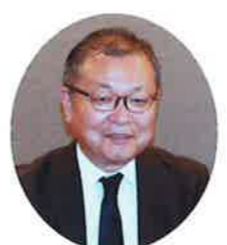
山田会長 利用可能な 手続を拡大 する予定で あります。本 年1月以降 なり、令和2 年1月以降

近年、税務行政を取り巻く環境は大きく変化しており、特に経済社会のICT化・グローバル化には目覚ましいものがあります。こうした変化の激しい時代に、引き続きその使命を果たしていくため、様々な取組を行ってまいります。