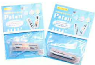
4種類の飲料用機能性セラミックス配合の「Poton」

水、お茶等に入れるだけ。使用後は水洗いし乾燥させることで、約1年間繰り返し使えます。 水専用と水・お茶兼用があり、それぞれ中身は違いますが、銀イオンによる消臭抗菌、及び水分子を活性化させ腐りにくくする効果に変わりはありません。普段使いの他に、災害時など水が貴重な場合に長持ちさせられるなど、今後の多様性にも期待されています。