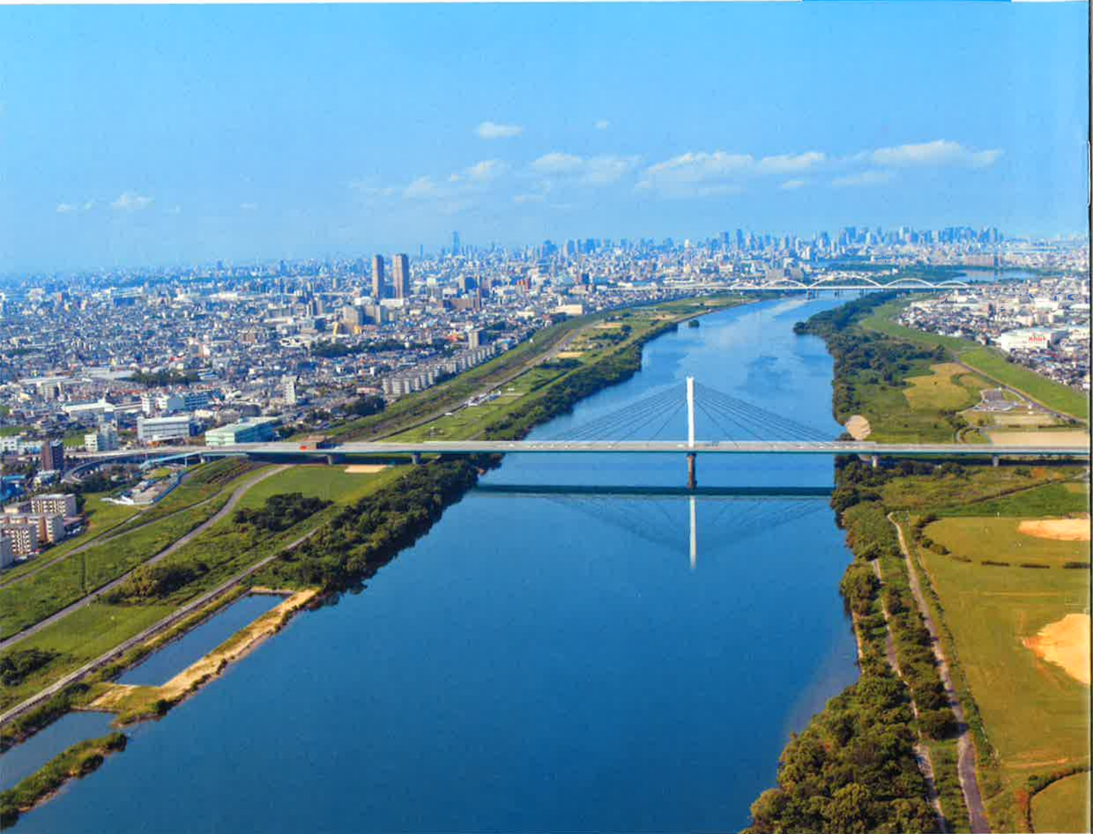
「淀川沿川空撮」