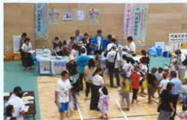
納税協会ブースでは税のPRを

8月3日(土) 門真市立総合体育館に於いて開催されたふるさと門真まつりに協賛出展しました。多くの市民が税金クイズに参加され、税のPRを行うことが出来ました。