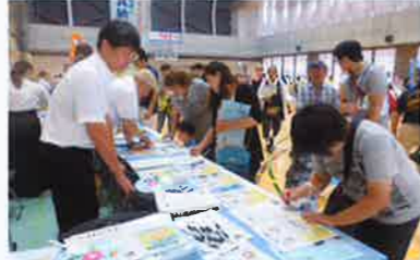
多くの方が税金クイズに挑戦