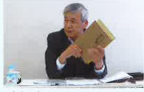
武士階級の学問の中心となった朱子学について講義する北山先生