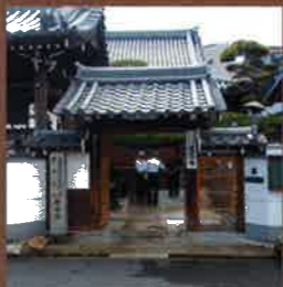
浄土真宗本願寺派 教應寺 守口市大日町2丁目28-16 電話：(06) 6902-3200