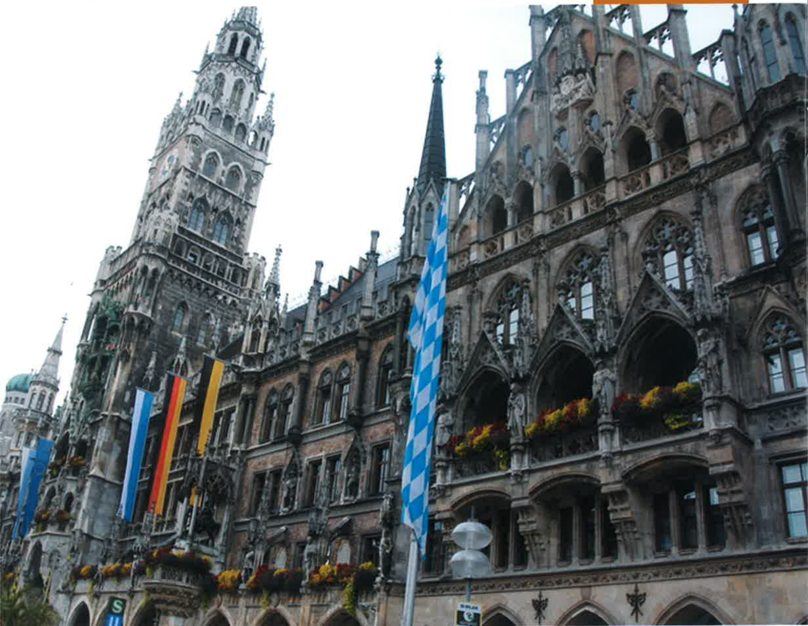
マリエン広場にある市庁舎