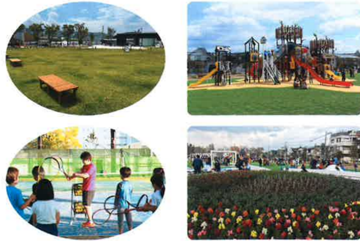
(右) 園内ガイドマップ (左上) おしゃべりやピクニックなどに最適な天然の芝生広場 (中上) 東側エリアにあるコンビネーション遊具の「大枝のとりで」 (左下) 屋外・屋内コート各2面備えたテニスコートは、足腰の負担を和らげる砂入り人工芝 (中下) 四季折々たくさんの花が楽しめるよう設置された花壇

生まれ変わった大枝公園！多目的施設・市民の憩いの場に！ スポーツ、健康づくり、遊びや教育等多彩な文化的活動を楽しむ 緊急災害時にはヘリポートにも！市民の安心安全を守る防災拠点