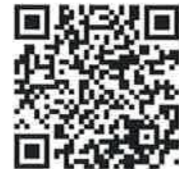
申告書の作成はこちらから！

令和2年1月から、 2か所以上の給与所得がある方 、 年金収入や副業等の雑所得がある方 など、 スマホ専用画面をご利用いただける方の範囲が広がります。