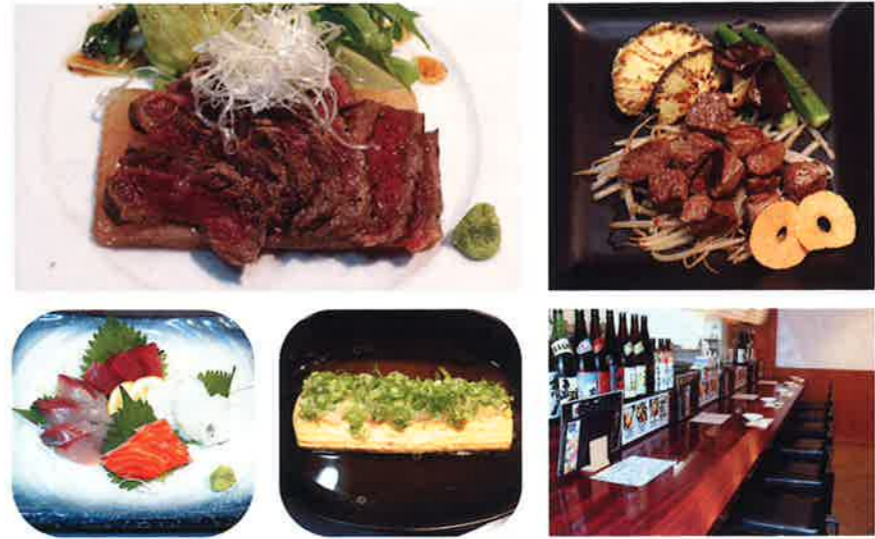
(左上) 黒毛和牛焼ききたてローストビーフ (右上) 黒毛和牛サイコロステーキ (左下) お造り盛り合わせ (中下) だしまき(ねぎ) (右下) 店内カウンター席