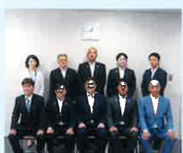
9/5 守口門真青年会議所との意見交換会