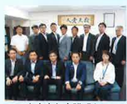
8/29 大東青年会議所との意見交換会

管内3青年会議所(守口門真青年会議所・四條畷青年会議所・大東青年会議所)と門真税務署幹部との意見交換会が、青年部会役員を交えて開催しました。