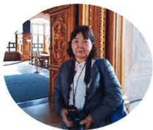
ルネッサンス最高傑作として 名高いアウグスブルク市庁舎 黄金の間にて

から国力を大切にするため貧富の差 を是正しインフラを整備しています。 消費税は日本の10%に比べドイツは 19%内税です。でも物価は高くなく、 また大学まで無料です。これも若者 を税金で支援するという仕組みです。 また教会税といひ、カトリックかプロ テスタントかを登録すると所得の7% 程度が課せられる事になるそうです。