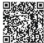
対象端末の一覧はこちらから！