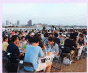
花火が打ち上がるまでの時間、会員交流を楽しみました

今年度は演出が一新され、頭上ではじける大玉の迫力や、視界一杯に広がる夢のような空間が体感でき、令和時代の新たな「なにわ淀川花火大会」の幕開けとなりました。