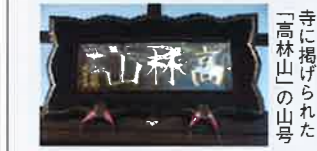
寺に掲げられた「高林山」の山号

教應寺(きょうおうじ)は、本願寺11世顕如上人が滞在して布教にあたった旧跡です。顕如上人といえば、元亀元年(1570)本願寺勢力を率い、織田信長と約10年にわたる長い戦争を続けた中心人物で、この抗争は石山合戦として知られています。 教應寺の創建年号は、守口市文化財報告書によると、本願寺から正式に寺号を授かったのは1704年と記されています。また、その礎は戦国時代、石山合戦のために各地より参陣し、その後守口に定着した多くの武将や農民達によって支えられ、築かれたと伝わっています。 教應寺の近くに今も残る藤之森跡には、本願寺派の武将、鈴木飛騨守重幸が陣取り、信長軍をかなり悩ませたと市史にも記され、ちょうど教應寺建立の時期と重なっています。