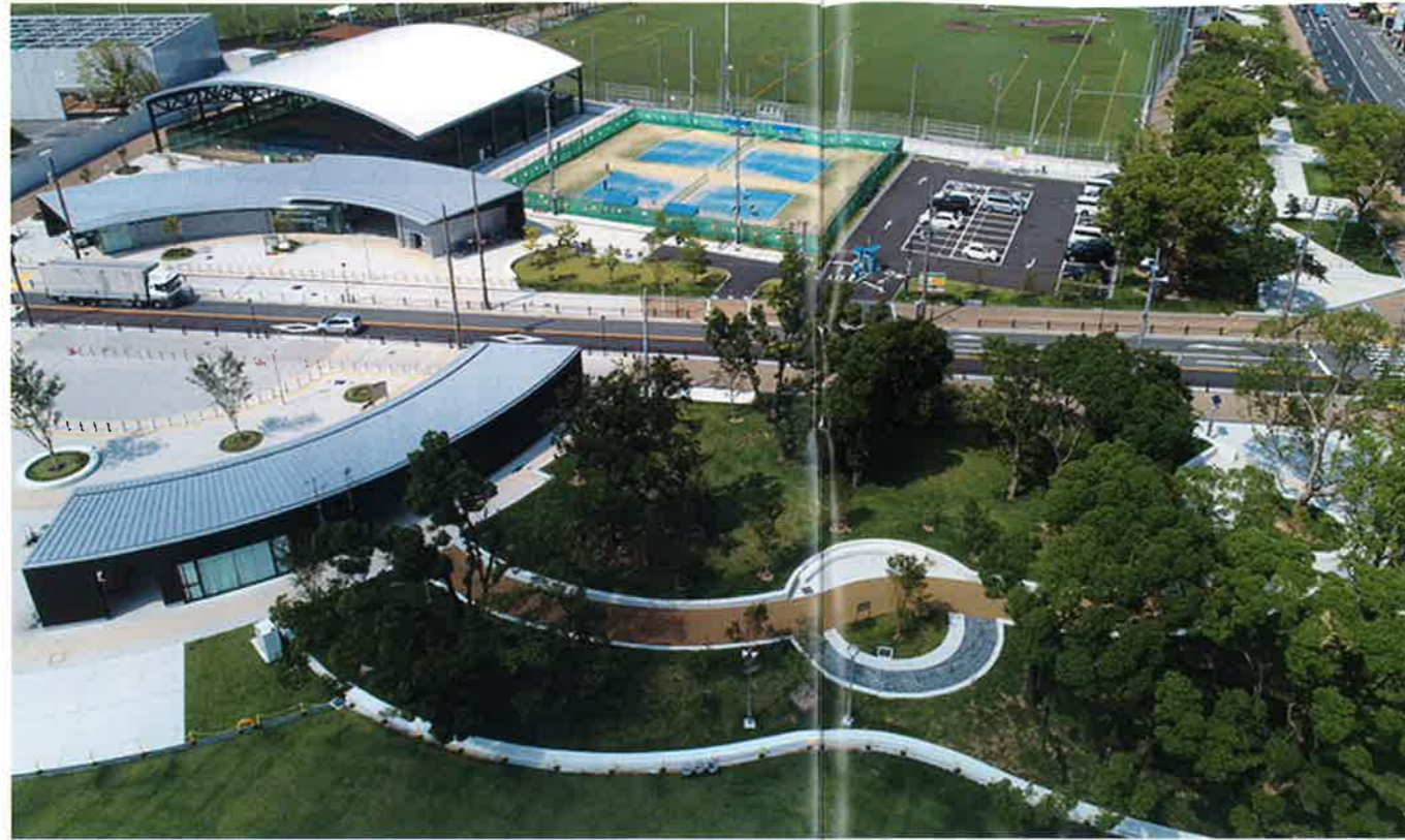
上空から見た大枝公園

今年は、11月3日(日・祝)に開催される「第34回守口市民まつり」の会場としても利用されます。この機会を利用してぜひ大枝公園に足をお運びください。