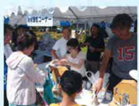
多くの市民の方達に税のPRをおこないました

当日は晴天で賑わい、様々な催し物が行われました。協会ブースにも子供から大人まで多くの市民の方がご来場され、税金クイズに参加いただき、大盛況で終えることが出来ました。