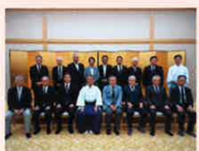
当日参加された広報部会役員の皆さん