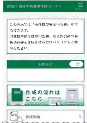
開発中の画面ですので、実際の画面と異なる場合があります。