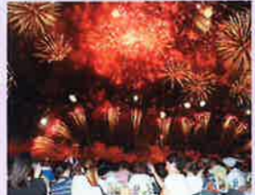
真夏の風物詩としてたくさんの花火が大阪の夜空を彩りました