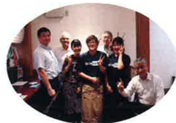
店舗スタッフの方々と広報部会役員