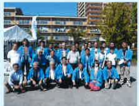
大東地区青年部会の皆さん