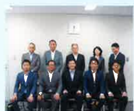
9/11 四條畷青年会議所との意見交換会