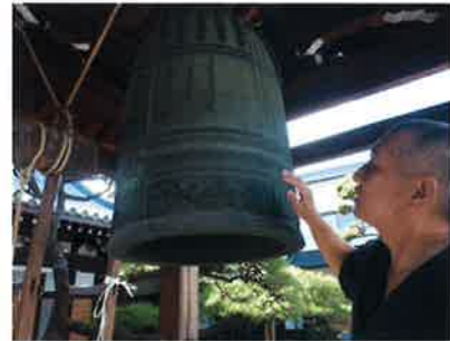
宝暦十三年(1763)銘の梵鐘。旧西成郡蒲田村(現在の淀川区)にあった大願寺から買い取られたもの。「長柄の人柱」伝説が伝えられています。