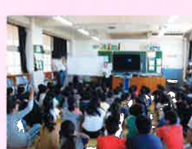
熱心に授業を受ける生徒達