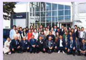
パナソニックアプライアンスヨーロッパ(株)松永社長はじめ現地企業の方と一緒に