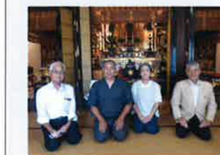
本堂にて、芳浦副住職と広報部会役員