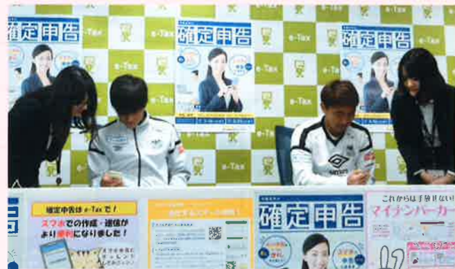
国税職員の説明を受け、スマホによる申告を体験する様子