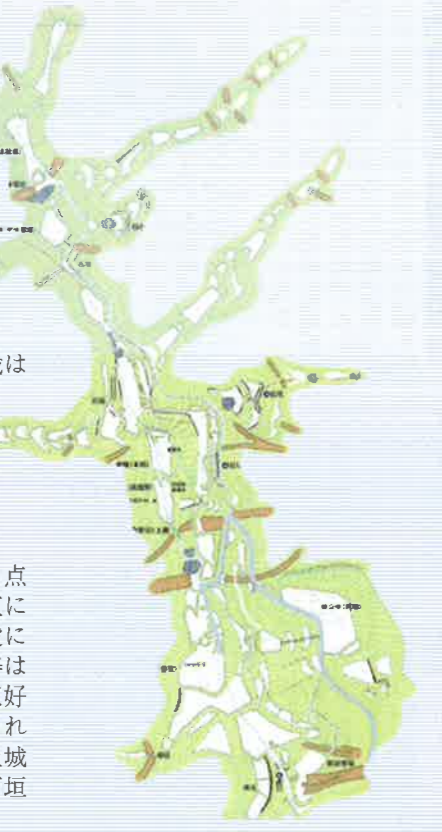
図の出版：「河内 飯盛城跡」摂河泉地域文化研究所 発行

標高約341mの飯盛山上に構えられた大阪府下最大の山城であり、その規模は南北約650m、東西約400mを測る。構造は大きく北城と南城に分かれ、北城は防御施設、南城は居住空間として利用されていたと考えられる。その特徴は何と言っても石垣が用いられている点で、自然石をほぼ垂直に積み上げた構造で段にもわたって築かれた姿は圧巻である。これは三好長慶によって大改修されたもので、信長の安土城に先駆けて築かれた石垣として注目される。