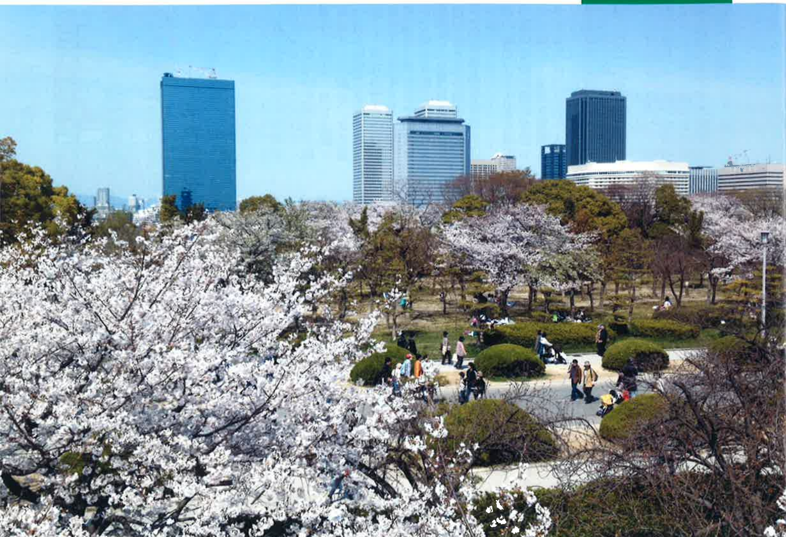
大阪城公園の桜