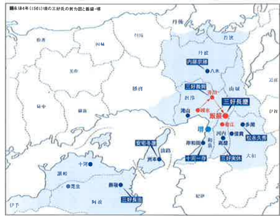
永禄4年(1561)頃の三好氏の勢力図と飯盛・堺

1954年名古屋生まれ、1984年から大東市在住。立命館大学文学部日本史専攻卒業。大阪府教育委員会文化財専門職員として長く勤務。現在、摂河泉地域文化研究所理事。考古学の立場で古代から近世の葬墓制について研究。また、近年は飯盛城跡をはじめ河内地域の歴史や文化についても調査・研究をおこなう。主な著作に『六道銭の考古学』『戦国河内キリシタンの世界』『地域と軍隊—おおさかの戦争と戦争遺跡』(いずれも共著)他多数。