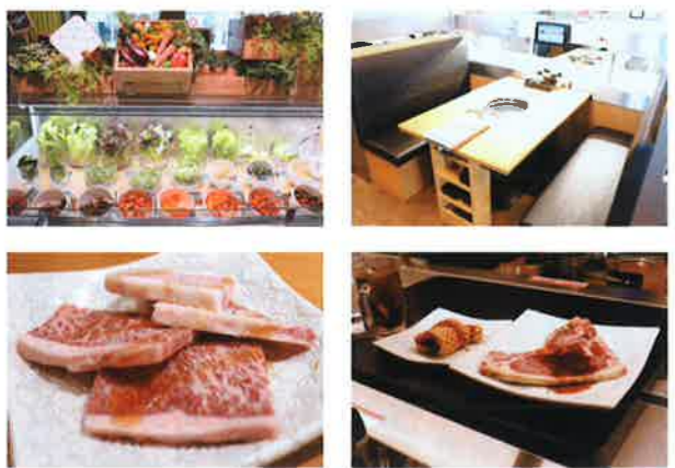
上左:種類豊富なサラダバー、上中:個室感覚の座席、右:迫力満点の「燃えよ!Lポーンステーキ」 下左:薩摩牛カルビ 下中:「永遠のダイヤモンドカルビ」と「燃えよ!Lポーンステーキ」

関西初出店! 鹿児島特産の黒毛和牛が食べ放題! 上村牧場直送、和牛の味は絶品格別! 話題の焼肉店は連日大盛況! 安心・安全の店内