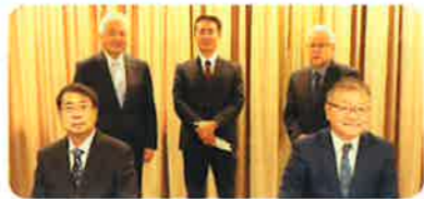
トップ対談を終えて、税務署と協会役員一同