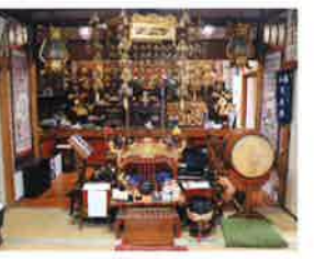
浄峰寺(性善寺) 本堂