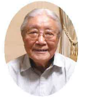
松下電器産業株式会社(現パナソニック)四代目社長