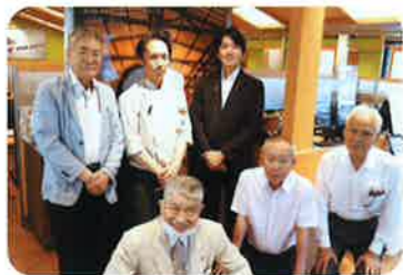
福井マネージャーと協会広報部会役員共々