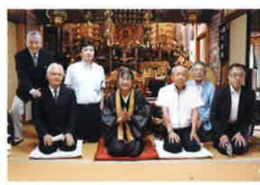
性善寺は全国でも大変珍しいLGBTサポートのお寺です。私自身が幼い頃から性同一性障害の当事者であったことから、他人には話しくい性的悩みの相談をはじめ、同性カップルの仏前結婚式、またそういつた方達や子孫のいない方などの永代供養の受付・相談もお受けしております。 守口に来て2年足らずですが、信者の皆さんはじめ、地域の方にも気さくに本寺へ来て頂きたいと思っています。性的マイノリティに対するサポートの他、四国、西国などの遍路・巡礼の拠点としても活動しており、令和2年10月24日、京阪ホールディングスの京阪フォーラムにて講演予定で、枚方、寝屋川、交野、四條畷の河内西国の巡礼をご紹介します。

人も出てきたようです。このお寺はこの宗派にも属さない単立のお寺でしたので、現在もそのままで。今は新型コロナウイルス感染症防止で活動も縮小気味ですが、法要の他、普段は毎月最終日曜日に縁日を行っており、祈禱や相談会・懇親会の場も設けております。 性善寺は全国でも大変珍しいLGBTサポートのお寺です。私自身が幼い頃から性同一性障害の当事者であったことから、他人には話しくい性的悩みの相談をはじめ、同性カップルの仏前結婚式、またそういつた方達や子孫のいない方などの永代供養の受付・相談もお受けしております。 守口に来て2年足らずですが、信者の皆さんはじめ、地域の方にも気さくに本寺へ来て頂きたいと思っています。性的マイノリティに対するサポートの他、四国、西国などの遍路・巡礼の拠点としても活動しており、令和2年10月24日、京阪ホールディングスの京阪フォーラムにて講演予定で、枚方、寝屋川、交野、四條畷の河内西国の巡礼をご紹介します。