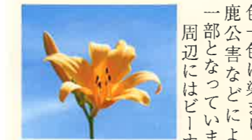
霧ヶ峰高原は長野県の中心部に位置し、夏は高山植物が咲き乱れることで知られています。ニッコウキスゲは一日花とも云い、一花が枯れると次の花が交代で咲きます。以前は高原一帯が黄色一色に染まりましたが、今は鹿公害などにより保護された一部となっております。 周辺にはビオナスラインが通っており、遮る物が無い緩やかな起伏は、ゆっくりと自然の景色を観察しながら楽しめます。

人も出てきたようです。このお寺はこの宗派にも属さない単立のお寺でしたので、現在もそのままで。今は新型コロナウイルス感染症防止で活動も縮小気味ですが、法要の他、普段は毎月最終日曜日に縁日を行っており、祈禱や相談会・懇親会の場も設けております。 性善寺は全国でも大変珍しいLGBTサポートのお寺です。私自身が幼い頃から性同一性障害の当事者であったことから、他人には話しくい性的悩みの相談をはじめ、同性カップルの仏前結婚式、またそういつた方達や子孫のいない方などの永代供養の受付・相談もお受けしております。 守口に来て2年足らずですが、信者の皆さんはじめ、地域の方にも気さくに本寺へ来て頂きたいと思っています。性的マイノリティに対するサポートの他、四国、西国などの遍路・巡礼の拠点としても活動しており、令和2年10月24日、京阪ホールディングスの京阪フォーラムにて講演予定で、枚方、寝屋川、交野、四條畷の河内西国の巡礼をご紹介します。