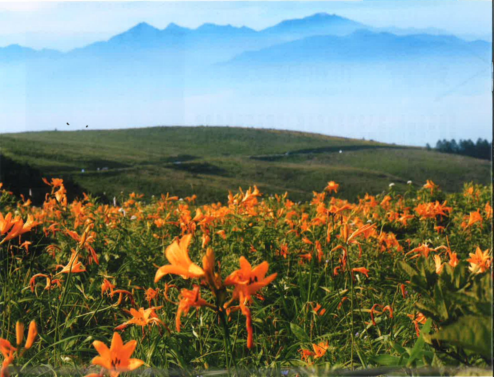
霧ヶ峰高原のニッコウキスゲの群落