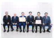
令和2年度事業計画及び収支予算の報告と、来賓の門真納税務署長より祝辞がなされ、無事定時総会を終了いたしました。総会終了後、感謝の贈呈式が行われました。

5月22日(金)納税協会会議室に於いて、第10回定時総会を開催致しました。今年度は新型コロナウイルスの影響により記念式典及び祝賀会が中止となり、また委任状提出による出席をお願いするなどの、規模を縮小して開催いたしました。総会では総会資格審査報告後、平成31年度事業報告及び収支決算報告について審議がなされ、異議なく承認されました。