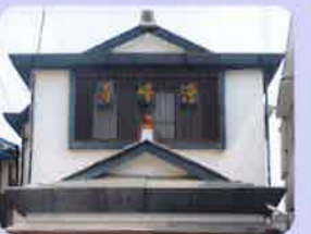
大徳山浄峰寺(性善寺) 住所:守口市大枝西町11-11 電話:090-3629-0044

大徳山浄峰寺(性善寺) 仏教における悉有仏性の性善説を大切に 宗派を超えてすべての人と地域に親しまれる寺へ