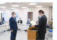
大阪国税局長感謝状

創立50周年感謝状の伝達及び披露 創立50周年記念国税局長感謝状の伝達及び納税協会連合会長感謝状並びに協会長感謝状の披露が行われました。