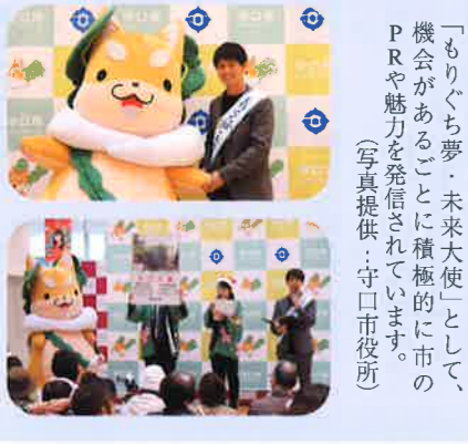
「もりぐち夢・未来大使」として、機会があることに積極的に市のPRや魅力を発信されています。

「『皆がこうあるべきだ、こうならないといけない』という生き方から、『これでいいんだ、自分らしく』という生き方に変わるんじゃないかなと思います。もちろんそこには自己責任は発生しますが。」 今までも色んな事に気を使ってきましたが、それを止めて自分らしく生きていく。わがままと言われようが、それが大切なので、そのいい見本になつたらいいなと思います。そういった意味で子供の頃の留学経験とか、人と群れるタイプではないので個性を活かした方がいい、といった親の教育方針に感謝しています。