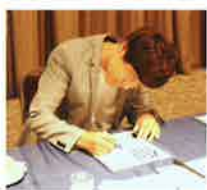
(下)色紙への寄せ書きも一文字ずつ真剣に書いて頂きました