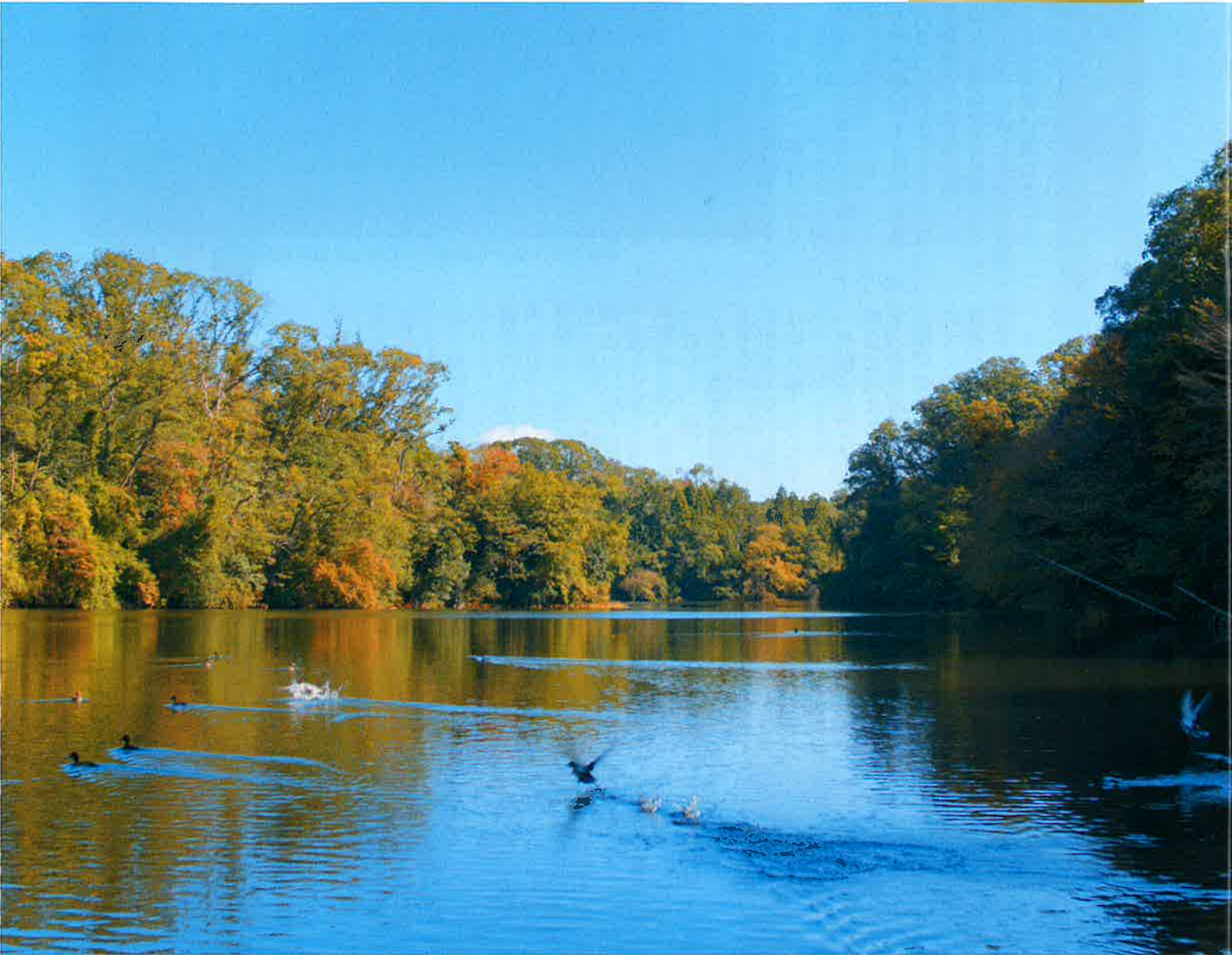
室池(四條畷市) 50周年記念映像より