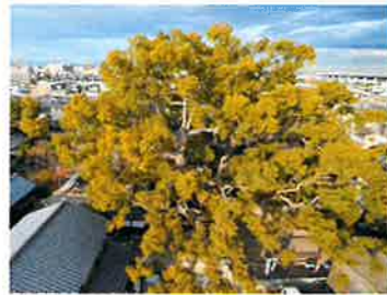
三島神社の葺蓋樟(門真)