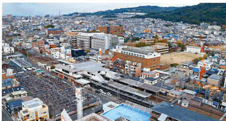
忍ヶ丘駅前周辺(四條畷)