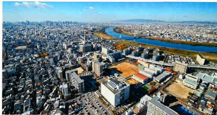
守口市役所と淀川(守口)