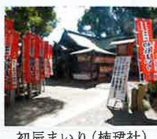
初辰まいり(楠瑠社)