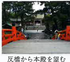
反橋から本殿を望む