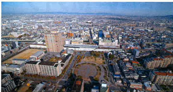
末広公園と住道駅前(大東)