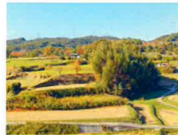
下田原地区の棚田(四條畷)