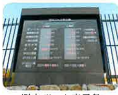
測定データ表示盤