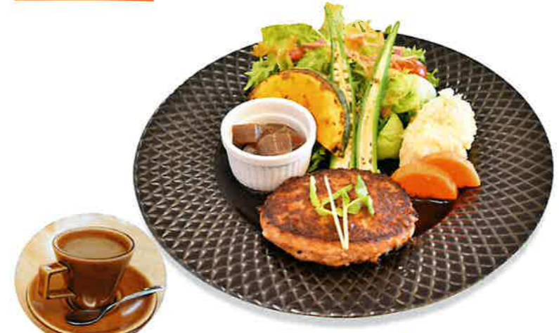
(上) Veggyバーグセット ¥910(ドリンク別)