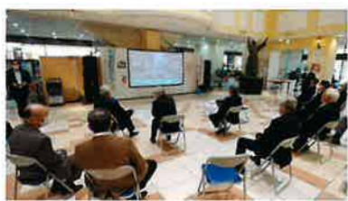
2020まちかどコンサート風景

令和2年11月10日、ポップタウン住道オペラパークにおいて、「税を考える週間」のイベントとして、税のパネル展示や税金クイズを行い、併せてまちかどコンサートを開催いたしました。今年も新型コロナウイルス感染拡大防止の観点から、一昨年に開催された「まちかどコンサート映像」、「50周年管内ドローン映像」、「税を考える週間紹介動画」の様子を放映いたしました。