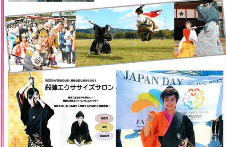
(右) 2017年カザフスタンで開催されたアスタナ国際博覧会に出演 その他、殺陣のご相談や教室へのお申し込みなど詳しくはHPをご覧ください！ → http://www.eonet.net.jp/chanbara/