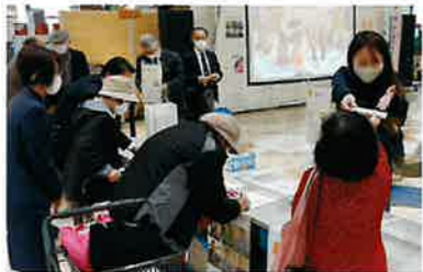
税金クイズとチラシの配布