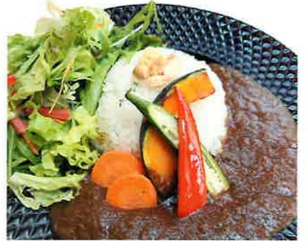
(下) チキングリルセット ¥910