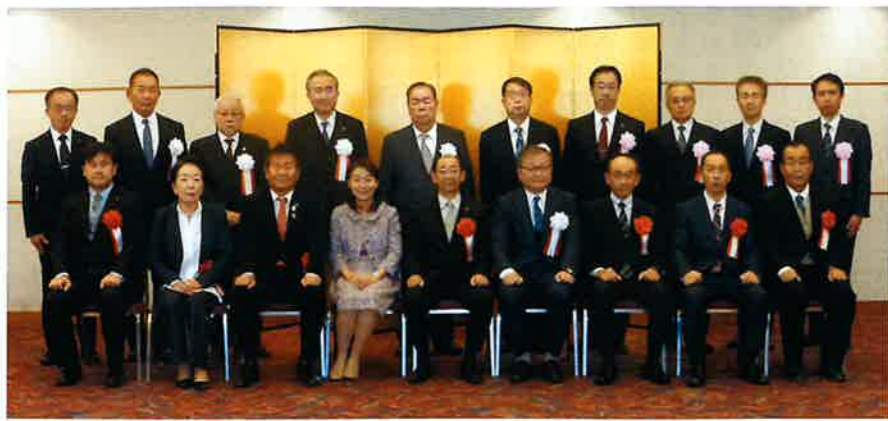
署長表彰及び協会会長感謝状の受彰者の皆様

受彰されました方は、多年にわたり各団体の事業活動を通じて、組織の拡大・育成に努められるとともに、申告納税制度の普及・発展及び納税道義の高揚に極めて顕著な功績を挙げられた方々です。◆今回の栄えある受彰者は次の方々です。(順不同・敬称略)