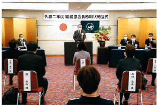
山田会長よりあいさつ