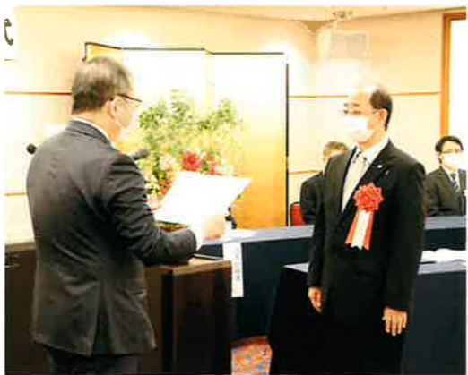
協会会長感謝状の贈呈