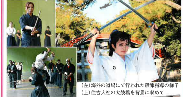
(左) 海外の道場にて行われた殺陣指導の様子 (上) 住吉大社の太鼓橋を背景に収めて

— 貴重な伝統文化芸能の継承に向けて、今後さらなる活躍を祈念致します。本日はお忙しい中お話を聞かせていただき、有難うございました。