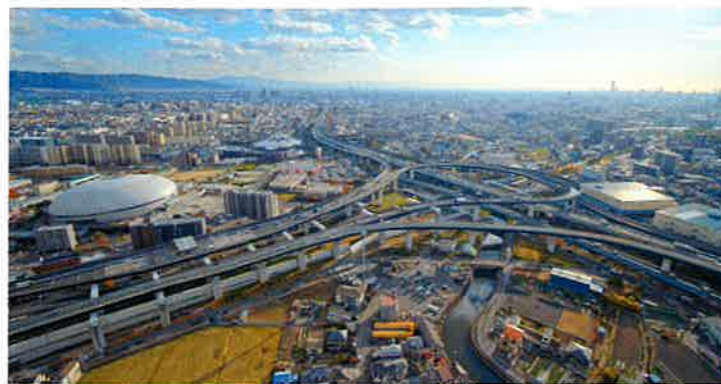
なみはやドームと門真ジャンクション(門真)