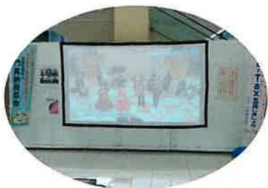
大型スクリーンでコンサートを放映