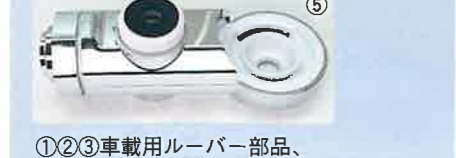
①②③車載用ルーバー部品、④シェーバー部品、⑤浄水器部品