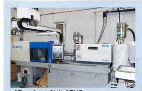
プラスチック射出成形機