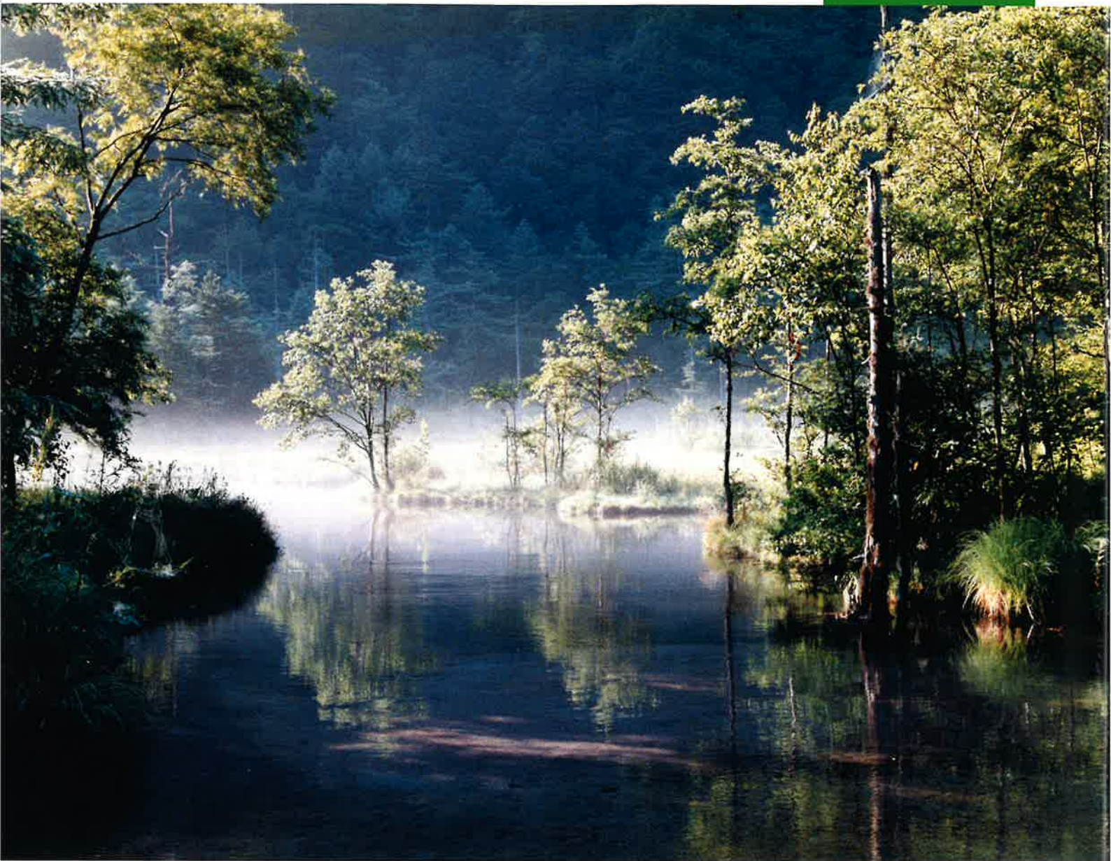
高地 田代池