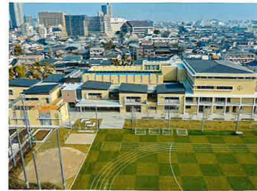
校舎航空写真

全滅させるだけの核兵器があるのに、 今まだ核開発に必死の国もあります。 (6) 良心なき快楽 自己の快楽を得るために他人を平気 で犠牲にする事件が後を絶ちません。 (7) 犠牲なき信仰 神仏を崇拜し頼りにするが、それに 対する犠牲つまり努力はしたくない という「虫のいい」考え方をする人が 増えています。 《善よく盤水を回す》 このように見てくると、誠に残念 ながらガンジーの予言した7項目は すべて現実のものとなってしまっ ています。 ではどうすればこの不幸な予言か ら逃れることが出来るのでしょうか？ それは、そのことに気づいた人が、 まず自分自身を律するとともに、自 分の周囲の人だけにでも良き影響を 及ぼしてゆくことだと思います。 「善よく盤水を回す」という言葉が ありますが、一本の箸で盤水つまり タライのように大きな器に入った水 をかき回しても、最初は全く水流が 起きないが、ずっと続けているとや がて水が動き出し、遂には渦を巻く までになるといふことです。お互い その「善」になり、周囲に渦を起こす 存在になれるようにしたいものです。 そうしてこれらの不幸な予言がはず れるよう、願わずにはおられません。