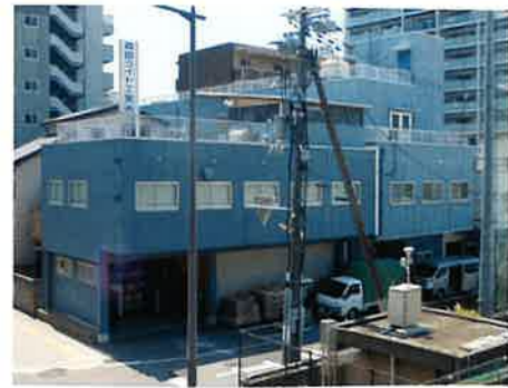
森田ライト工業株式会社 本社全景