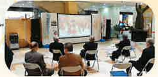
令和2年度風景 (コロナ対応の為映像放映)