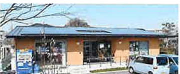
デイサービス ちよの里 所在地：四條畷市北出町18-24 TEL：072-863-2115