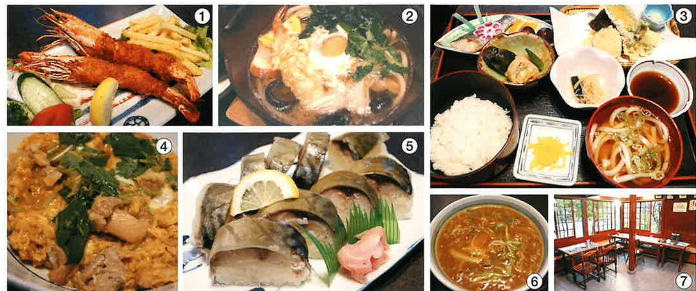
①おおきなエビフライ定食(¥1,850)は迫力満点の頭付きエビフライ!②鍋焼きうどん(¥950)寒いときはこれ!体が温まります。③和食の定番、天ぷら定食(¥1,650)④親子丼(¥900)アツアツご飯にとろ〜り卵がうれしい!⑤くるまや自慢のさば姿寿し(¥2,050)はお持ち帰りもできます。⑥カレーうどん(¥980)出汁がしっかり効いた特製。⑦店内1階左奥、テーブル席の様子