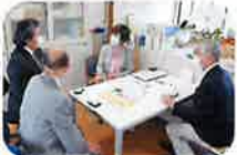
取材はコロナ禍を反映し、少人数で行いました。