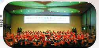
令和元年度風景 (R2年度は中止)