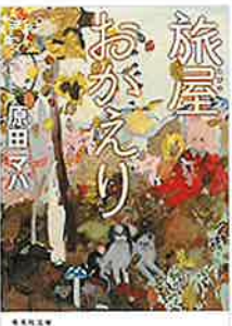
集英社文庫 著者：原田マハ

「ばね」は色々な分野で使用されています。特に自動車は「ばね」の使用される点数では抜けており、経済産業省の統計でも自動車の生産動向とばねの生産動向は比例しています。しかし、関西では特に電機業界の伸びに歩調を合わせてきた業界、そして弊社も伸びて