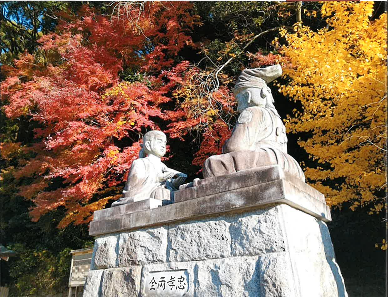
四條畷神社「桜井の別れ 忠孝両全」