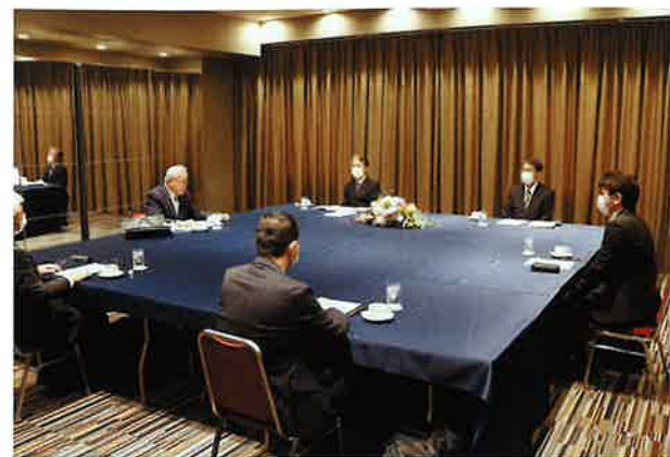
新型コロナウイルスへの感染対策を取りながらの特別対談