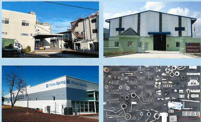
(左上)四條畷の本社、(右上)ベトナム工場、(左下)メキシコ工場、(右下)取扱い製品