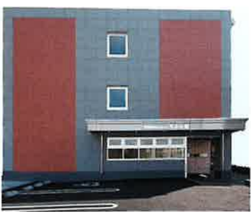
住宅型有料老人ホーム「ちよの里」 所在地：四條畷市二丁通町23-10 TEL：072-879-0033