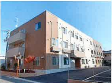
サービス付き高齢者向け住宅「ちよの里式番館」 所在地：四條畷市二丁通町5-22 TEL：072-863-1177