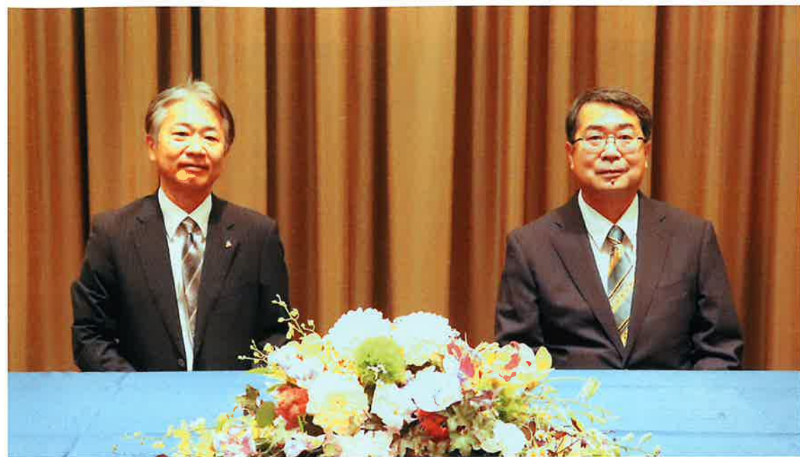
公益社団法人 門真納税協会 会長