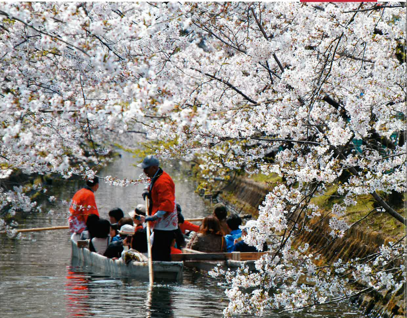
砂子水路の田舟(門真市三ツ島)