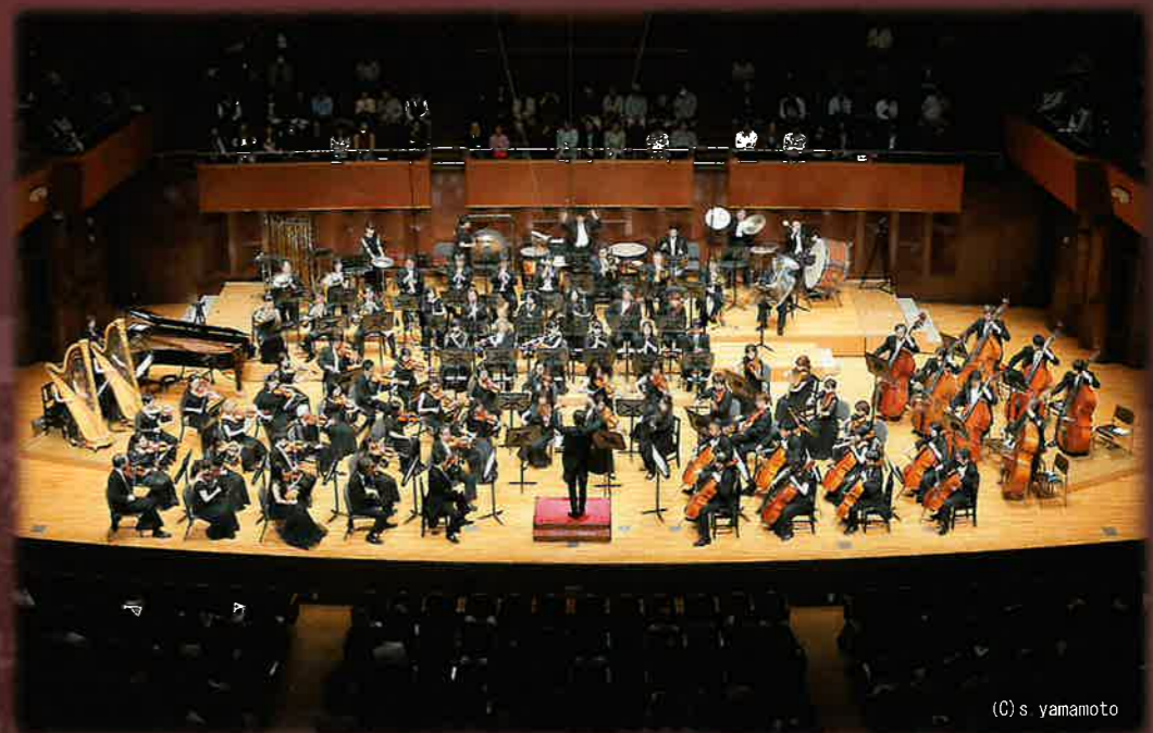
(C) s yamamoto