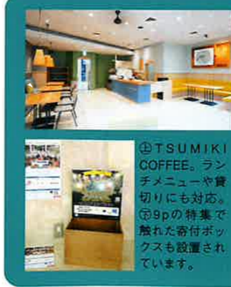
④TSUMIKI COFFEE。ランチメニューや貸切にも対応。⑤9pの特集で触れた寄付ボックスも設置されています。

①約1,100席を有する大ホール ②約250席の小ホール ③客席裏側の電子案内板