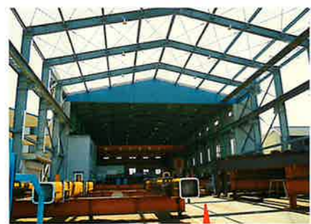
東田工場 【所在地】門真市東田町3-2 【保有面積】2,302㎡

総合力と誠意をもってあらゆる空間を創造 弊社は元古鉄工所として創業し、昭和43年に現在の「元古鉄工株式会社」へ組織変更、昭和48年に本社工場及び事務所を門真市へ移転しました。 「鉄工」と社名にあるように、設立当初は鉄骨加工・組立の請負を行っていました。しかしその後、一級建築士事務所の登録を行い、現在では建築鉄骨はもちろんのこと、建物の内外装に至るまで総合的に建築を手掛けており、幅広い企業様とお取引させていただいております。 事業部は大きく二つの分野に分かれており、一つ目の鉄骨事業部では、営業から現場施工に至るまでお客様のニーズにお応えした鉄骨製作を行っています。見積もり調達、生産・品質管理、現場管理の各分野に分けてそれぞれ専門スタッフが対応することにより、高品質な製品を短期かつ一元的に提供することが可能です。多くの工場・倉庫などの建築鉄骨の製作を担っています。また、協力会社も含めると鉄骨加工能力は年間約1万2千トン。国土交通大臣認定工場Hグレードのほか、環境負荷低減活動としてISO14001も取得しています。 二つ目の建設事業部は、建築物全般について、設計・監理及びそれに伴う工事管理を行っており、基本的にはリニューアル工事が中心になっています。また、建設事業部内でもさらに設計部と建設部の二つに分け、相互に連携して小回りの効く体制、素早い対応を心がけて活動しています。規模としては従業員数20名ほどの組織により、近隣のお客様を中心に、地元地域で主に展開している状況です。 もともと弊社は鉄工所からスタートしたということもあり、鉄工部門が事業の3分の2を占めています。 特に、倉庫や工場に関しては長年の経験から様々な視点にたった提案や対応が可能で、各部門が協力し設計と施工、最終的なメンテナンスまでトータルでサポートし、建物全体にわたる作業を一貫