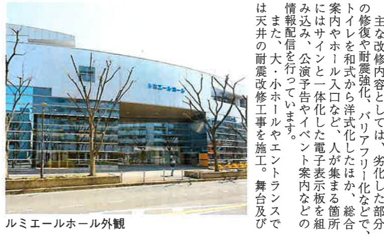
ルミエールホール外観

別府さん 現在、ルミエールホールは開館より25年以上が経過していることから、より安心・安全にご利用していただくため2019年4月から1年間、全館を閉鎖してリフレッシュ工事を行いました。さらに使いやすく親しみやすいホールとして生まれ変わっております。