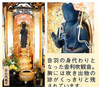
とわりの身代わり、観音の残像が、羽たはくきり音が胸跡されています。

四條畷市南野三丁目の権現川沿いにある「紫雲山 弥勒寺」は、永禄7年(1563)に建立されたといわれている由緒ある寺院です。「舎利吹観音」の民話が伝わることも知られており、悪瘡治癒に効験が有るとして今も多くの参拝客が訪れます。階段を上り山門をくぐればすぐ正面に本堂。境内には石造物や梵鐘などが安置されており、清閑な佇まいとなっています。