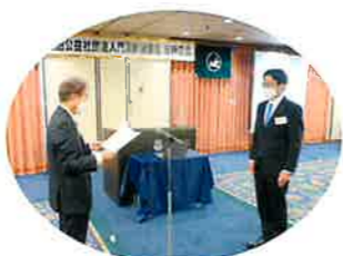
総会終了後、組織拡大にご尽力頂いた方々へ感謝状を贈呈

5月31日(火)午後4時よりホテルアゴラ大阪守口に於いて、門真税務署長、大阪府北河内府内府税務所長、近畿税理士会門真支部長を始め来賓をお迎えし、第12回定時総会を開催しました。永來会長が議長となり、令和3年度事業報告及び決算について承認可決されました。