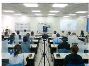
決算期別説明会及びインボイス制度説明会