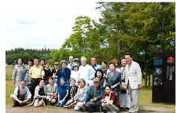
三内丸山遺跡にて