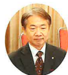
藤本部長 対談終了後、署幹部、協会長、担当副会長と広報部会長

ル化が一層加速しており、国税組織としても、データやデジタル技術を最大限活用して経済社会の変化に対応していくことが重要であります。このため、昨年6月に国税庁が公表した「税務行政のデジタル・トランスフォーメーション」税務行政の将来像2.0」において、「あらゆる税務手続が税務署に行かずにできる社会」の実現を目指しております。 具体的には、スマートフォンを利用したe-Tax、添付書類を含めたe-Tax、非対面の納付手段であるキャッシュレス納付の利用拡大を推進してまいります。 また、来年10月にはインボイス制度が開始されます。インボイス制度の内容について、事業者の皆様には十分に御理解いただき、制度開始に向けた事前準備を進めていただけるよう、関係省庁や関係団体の皆様と緊密に連携を図りながら、納税者の方への着実な制度の周知・広報や丁寧な相談対応に取り組んでまいります。 さらに、適正公平な課税・徴収の実現への取り組みとして、適正な申告・納税を行った納税者が不公平感を抱くことがないように、悪質な納税者に対する厳正な対応に取り組んでまいります。 しかしながら、これらを遂行する上で、私どもの力だけではなし得ないところも、ございますので皆様方には、今後とも、より一層の御理解と御協力を賜りますようお願い申し上げます。 藤本部長 続きまして、永来会長より協会活動と運営の抱負をお願いします。