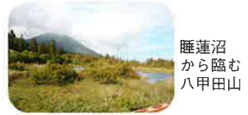
睡蓮沼から臨む八甲田山

6月24日(金)～26日(日)門真納税協会主催で、26名の参加者を迎え、「新緑の奥入瀬と八甲田の旅」を行いました。新型コロナウイルスの感染予防策を講じながらでしたが、久々の国内旅行で親睦と交流が図られました。