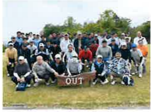
プレー前に、青年部会長、担当副会長の挨拶とルール説明。コロナ感染防止の観点より成績発表は実施せず後日送付いたしました。

5月11日(水)奈良柳生カントリークラブにおいて、15組54名の参加者を迎え3年ぶりに開催。今回は、チャリティゴルフとして行い、日本ユニセフ協会を通じて、ウクライナの緊急募金へ寄付を行いました。