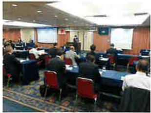
オンライン(ZOOM)を活用して開催された定時総会