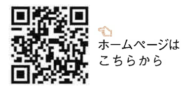
ホームページはこちら

> About モーニング 7:00~ 9:30(火・金のみ) ランチ 11:30~15:30(15時LO) 〔定休日〕水・土(第3のみ営業) 日・祝 ※営業時間や日替わりメニューの確認など、詳しくはHP又はInstagramにて