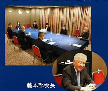
藤本部長 和やかな雰囲気の中、アフターコロナを見据え、協会のこれからの活動へ向けた意見交換がなされました。