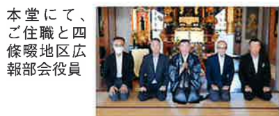
本堂にて、ご住職と四條畷地区広報部会役員

庚申信仰とは、庚申(かのえさる)の日に徹夜して眠らず、身で起きるといふ信仰です。旧暦では60日に1度、庚申の日が巡ってきますが、この日は人間の体内に住んでいる虫がその人の日頃の行いを報告するといふ道教の教えがありました。なので、人々は夜通し眠らず天帝を祀り、勤行や宴会をして過ごしたということです。