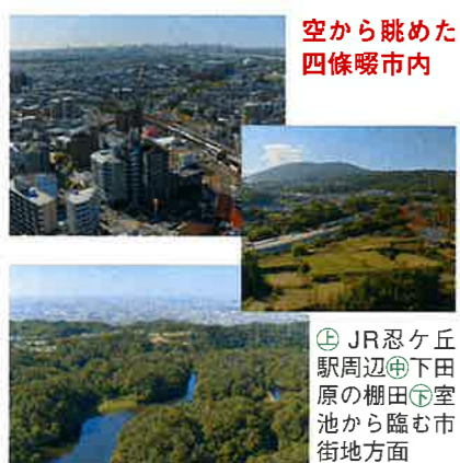
空から眺めた四條畷市内

現在、対応策の一つとして「デマンドタクシー」の運用を計画中です。一種の乗り合いタクシーのようなもので、まだ実証運行の段階ですが、巡回できるようにするとスマートフォン実現への第一歩になるのではと考えています。また、市内の公共施設においても築年数が経過し、耐震補強が十分でないものや老朽化が目立つものが増えてきました。