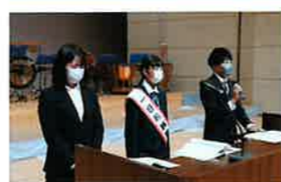
1日税務署長も税金クイズを出題