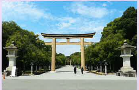
第一鳥居から西に向かって伸びる表参道。奥に見えるのは第二鳥居、両側にはカシの並木が続いています。

約50万㎡(甲子園球場約13個分)と広大な敷地内には、国の重要文化財にも指定された重厚で美しい社殿をはじめ、周辺の自然が織りなす四季折々の風景、毎年話題の大絵馬など、見所が沢山あります。近年では参拝者も増え、歴史と美を堪能するのにぴったりです。