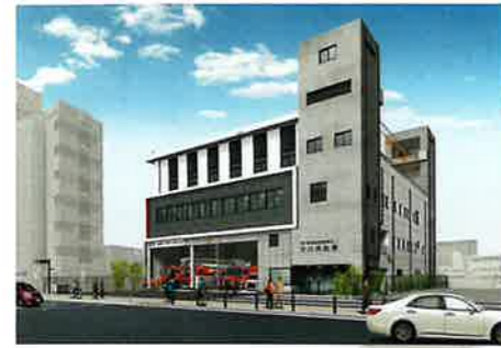
完成予想パース