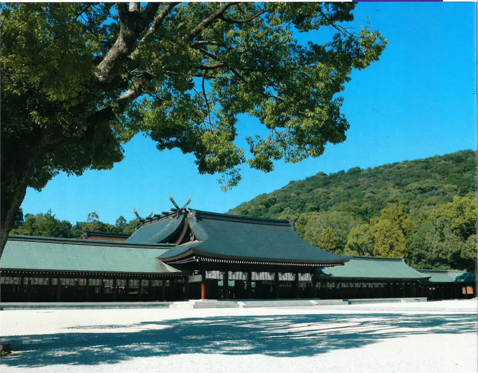
心静まりて 写真：橿原神宮(奈良県)