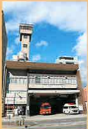
半世紀以上にわたり運用されてきた現庁舎

まもなく、守口消防署が新庁舎となって生まれ変わります。火災の予防や消火、災害・事故現場における救助、救急活動など、長年にわたり、市民の安全安心な暮らしを支え続けてきましたが、このたび約150m西側、旧市民会館跡地に移転新築されることに。新たな防火防災の拠点として、期待が寄せられています。新庁舎の機能や構造などについて、守口市門真市消防組合の方に伺いました。