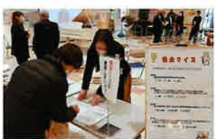
税金クイズコーナー