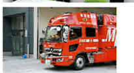
守口市門真市消防組合の会が、皆さんと守口地区広報部員と取材中に見学させていただきました。