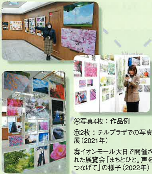
⑥写真4枚：作品例 ⑦2枚：テルプラザでの写真展(2021年) ⑧イオンモール大日で開催された写真展「まちとひと。声をつなげて」の様子(2022年)

「い」という目標があり、実はラジオに興味があったわけではありませんでした。けれど専門学校で、自分があるまじり演技が上手じゃないということに気づき、(笑)自分のやりたいことを模索する中、当時、所属している事務所の社長がラジオで番組をやっていた関係で「守口に住んでるならせっかくなし、勉強のためにちょっと一緒にやってみひんか？」と声を掛けてもらい、それがきっかけでラジオパーソナリティの道に踏み入れることになりました。活動するうえで失敗や苦労したことなどはございますか？