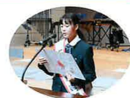
税の優秀作文朗読