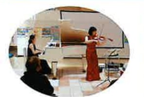
まちかどコンサート