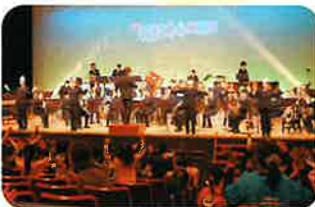
キッズコンサート