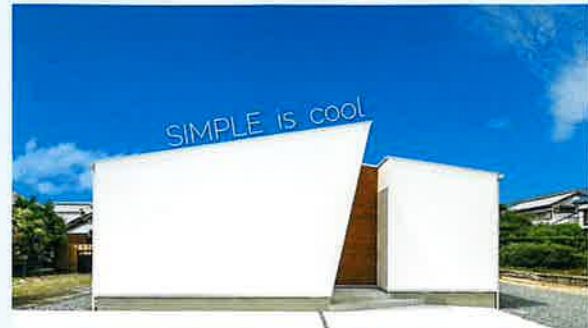
デザイナーズ注文住宅「SIMPLE NOTE」の施工例 最大の特徴は視覚的要素の圧倒的に少ない、シンプルなデザイン