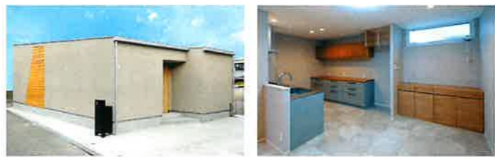
外から見えやすい道路面などの方向に、むやみに大きな窓を作らないことで視線を気にすることが無くなります。防犯性能が上げられると同時に、カーテンや雨戸の出費が抑えられます。

限られますよね。また、年を取れば最終的に夫婦2人だけになるといふことも十分に考えられます。その時、家が広いと持て余し、負担になるといふのが事実です。 弊社はそうした今までの住宅業界に根付く「間違った当たり前」から脱却し、無駄を省いた「本当に必要な家」というものを目指しています。 現在私たちが提案しているデザイナーズ注文住宅「SIMPLE NOTE」は、その名の通りシンプルなデザインが特徴です。快適さや暮らしやすさを保ちながらも、不要なものを取り除いた、まさにミニマルな暮らしを求める方の理想を形としたものとなっております。 確かに以前は私も「夢を語ってください、ぜひ夢を現実に。」と言ってま