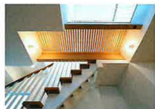
外側の窓を減らした分、中庭や吹き抜け、スリット廊下を設けて採り入れる設計と自然で心地の良い光が包み込みます。