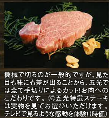
機械で切るのが一般的ですが、見た目も味にも差が出ることから、五光では全て手切りによるカット!お肉へのこだわりです。⑤五光特選ステーキは実物を見てお選びいただけます。テレビで見るような感動を体験!(時価)