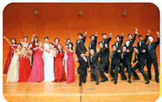
ファミリーコンサート