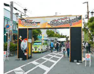
JR忍ヶ丘駅の周辺にて開催された、「なわてオクトーバーフェスト」&「ナワテショウコウマルシェ」の様子(2019年9月)。たくさんの地元飲食店が集まり、たいへんな賑わいを見せました。

概要と理念 商工会とは、「商工会法」(昭和35年施行)という法律に基づいて設立された商工業者のための非営利法人です。地域の事業者が業種に関わりなく会員となり、お互いの事業の発展や豊かな街づくりのために、総合的な支援活動を行っています。 マークの中央にあるSは「商業」の頭文字を、それを囲む歯車は「工業」を意味しており、組織の団結と無限の発展を象徴しています。 商工会の基本理念は、地域商工業と地域社会とのかわりを十分認識しながら、地域商工業の総合的な改善を発達を推進することにあります。