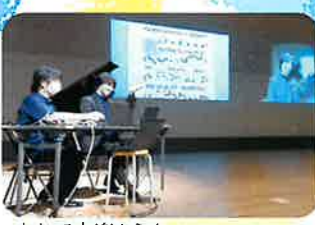
なわて音楽セミナー

いずれも音楽を身近に親しむことを目的とした事業です。ファミリーコンサートでは、小中学生を対象としたプロ合唱団による多彩なプログラムが、キッズコンサートでは未就学児を対象に、ホールで生演奏を体験することで芸術への好奇心を育みます。