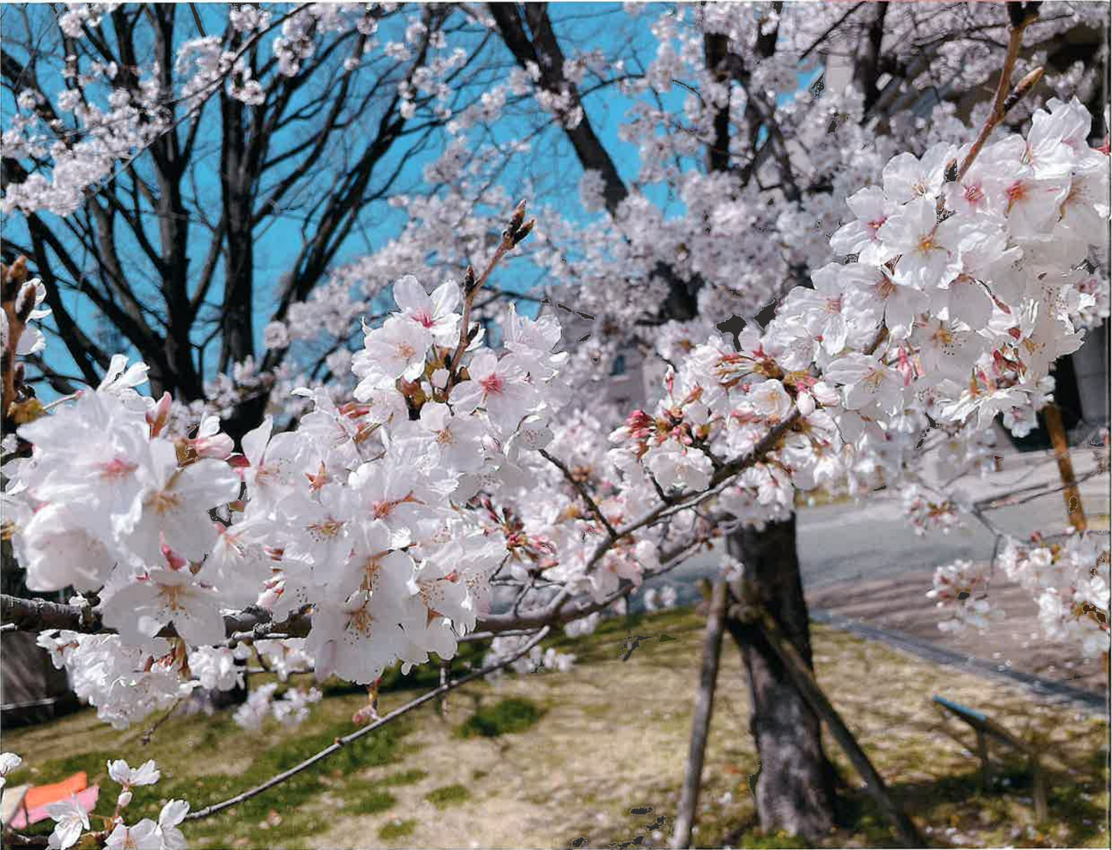
大阪大学医学部付属病院の桜