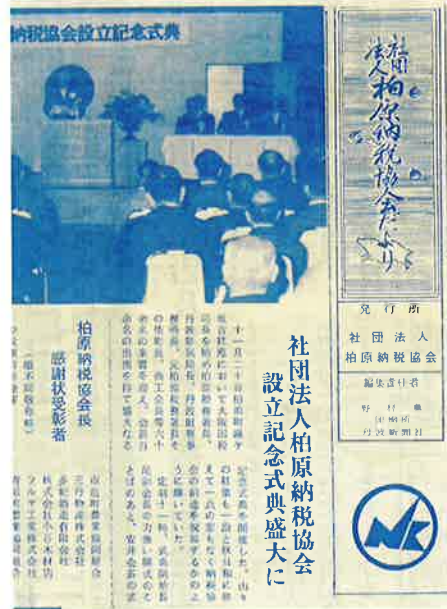
社団法人化の記念式典を報じる「社団法人柏原納税協会だより」第1号

本誌の創刊号は1980年12月10日付。本協会が社団法人化した機会に「社団法人柏原納税協会だより」として発行されました。1面には大阪