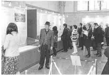
特別展示『大同生命の源流 “加島屋と広岡浅子”』