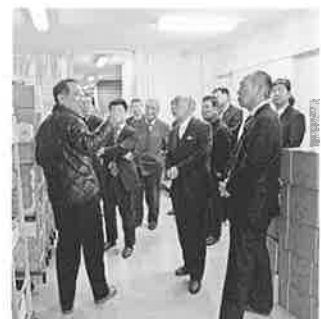
社長の説明を真剣に聞く会員

ナイフ一つ一つにも所在場所や番号が振ってあり、ものを大切にされている姿勢が表れていました。何錢という細かい商品で利益を残されるのは、この様な細やかな気配りが出来ているからこそだと感じ、