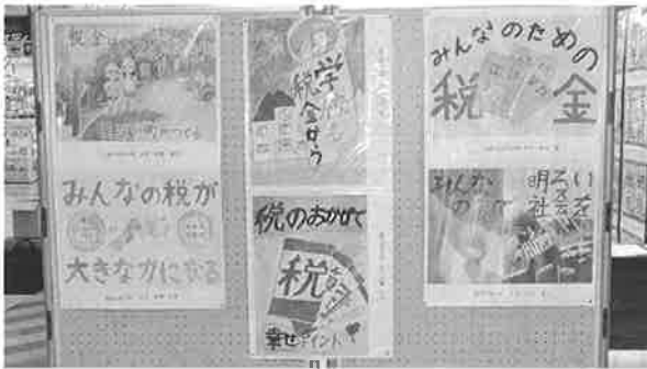
コモレ丹波の森センターコート 書道・ポスター作品展