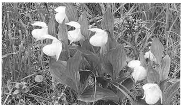
レブンアツモリソウ