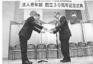
法人青年部 創立30周年記念式典