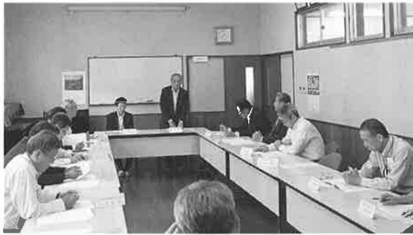
柏原納稅貯蓄組合連合会 定時総会

広報誌については、本年度も納稅協會の「納稅だより」の発行に協賛し、内容もより一層充実したものにしたいと考えています。本年も引き続き、目標を定めてe-Tax(電子申告・電子納稅)の普及に力を注ぎたいと思っております。